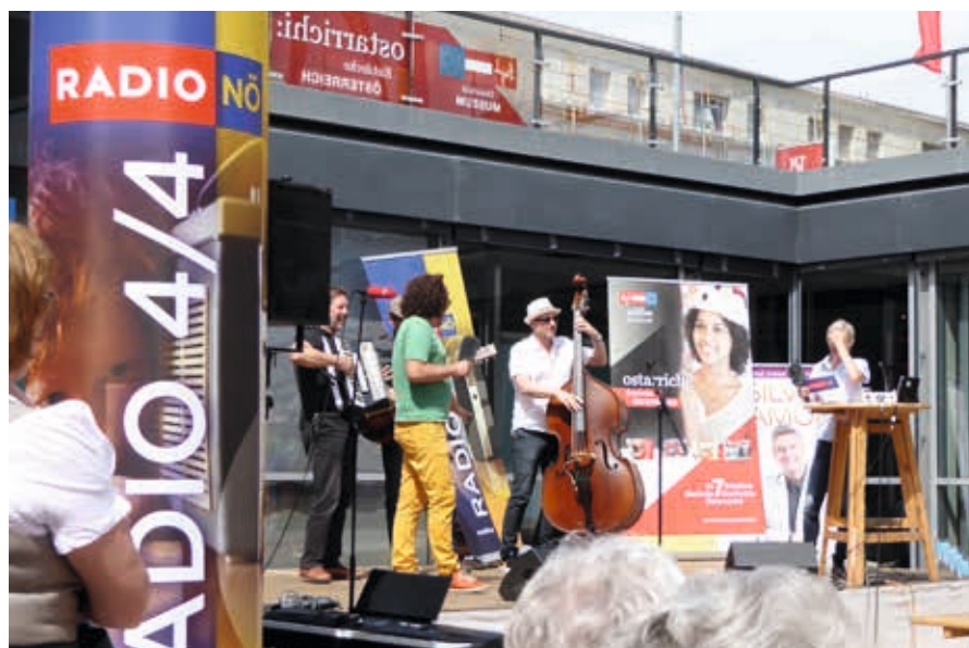
Museumsfrühling mit Radio 4/4

Am 16. Oktober treffen einander zahlreiche Jugendliche, um Fragen zu politischen Entscheidungsprozessen zu