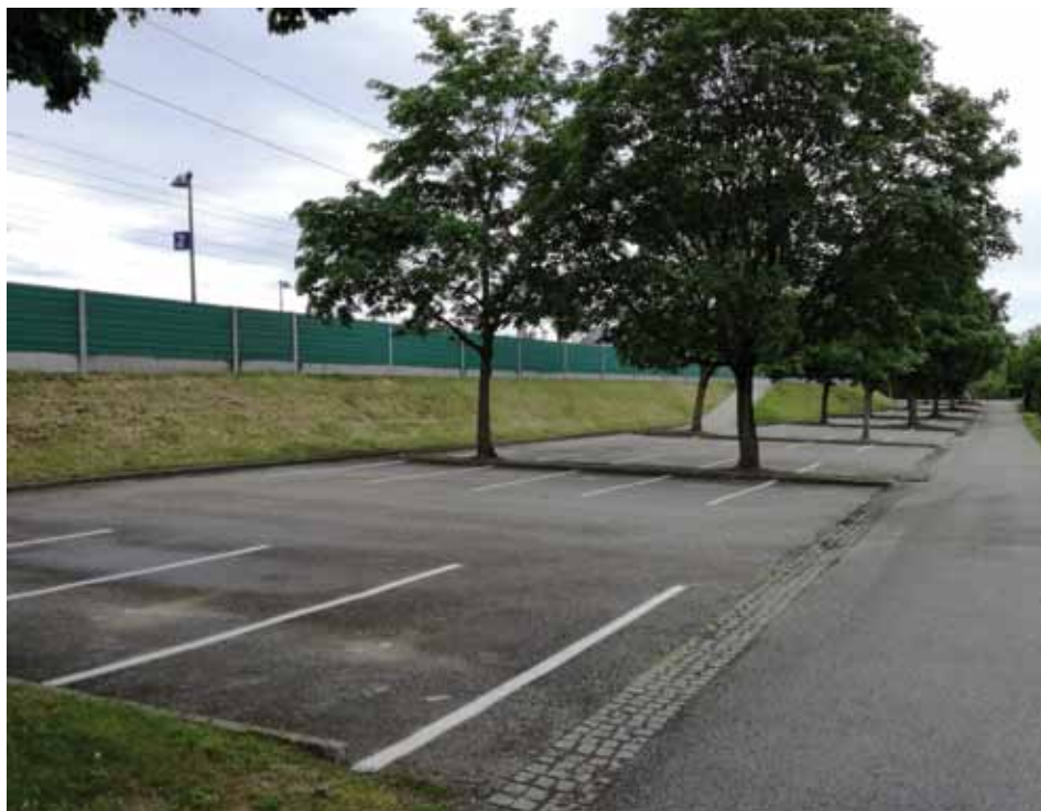
Die modernisierte Park&Ride Anlage Ennsdorf.

Weiters erhielt bereits jeder Parkplatz einen Sensor, der zuverlässig die Belegung meldet. Ab Herbst können die ersten KundInnen vom neuen Service profitieren.