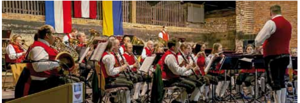
Konzert am Bauernhof 2018.