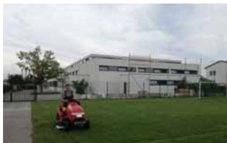
Mäharbeiten am Sportplatz.

In der Krabbelstube gab es Vorbereitungsarbeiten für die neuen Spielgeräte. Weiters waren im Gemeindegebiet viele Mäharbeiten notwendig (z. B. am Sportplatz bei der Volksschule).