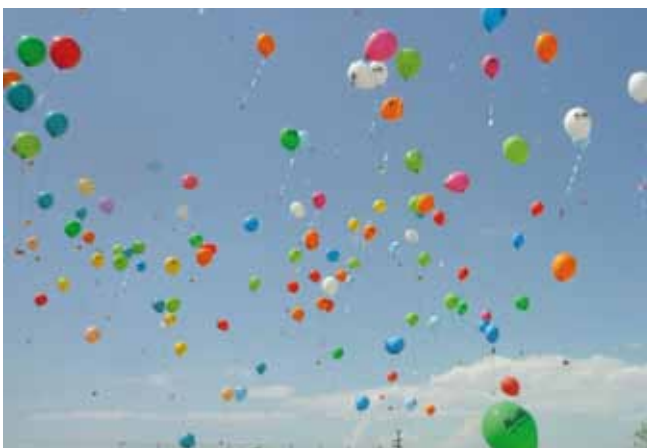
Bild: Luftballonstart beim Schulsportfest.

Der Elternverein und die Schulleitung freuen sich auf Ihren Besuch!