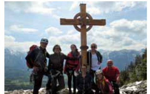
Naturfreunde in Bad Goisern.

Neulinge sind jederzeit willkommen, gefahren wird jeweils in unterschiedlichen Leistungsgruppen, sodass ein Einstieg jederzeit möglich ist.