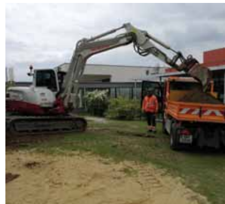
Vorbereitungsarbeiten im Kinderhaus.