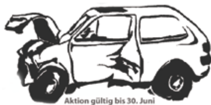
Aktion gültig bis 30. Juni

Anmeldung ab sofort am Stadt/Gemeindeamt