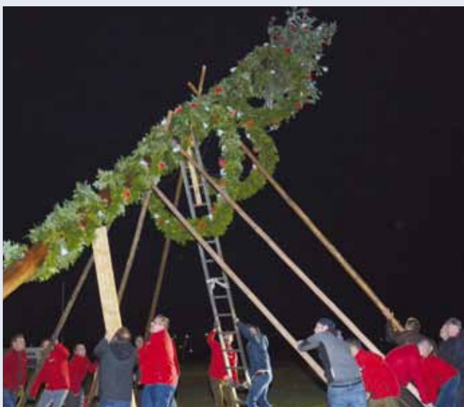
Tatkräftige Unterstützung beim Maibaumaufstellen.

Die SPÖ Ennsdorf bedankt sich bei den zahlreichen Besucherinnen und Besuchern.