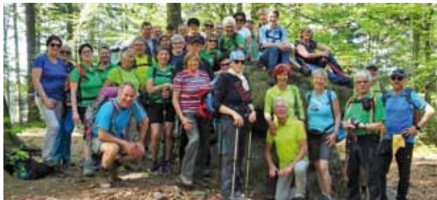
Naturfreunde in Natternbach.

Kürzlich erforschten die „Wanderer die Zeit haben“ bei ihrem monatlichen Termin das Hausruckviertel. Bei mildem Frühlingwetter erkundeten die Wanderer die sanfte Hügellandschaft rund um Natternbach. Die Veranstaltung verzeichnete mit 38 Teilnehmern einen neuen Rekord.