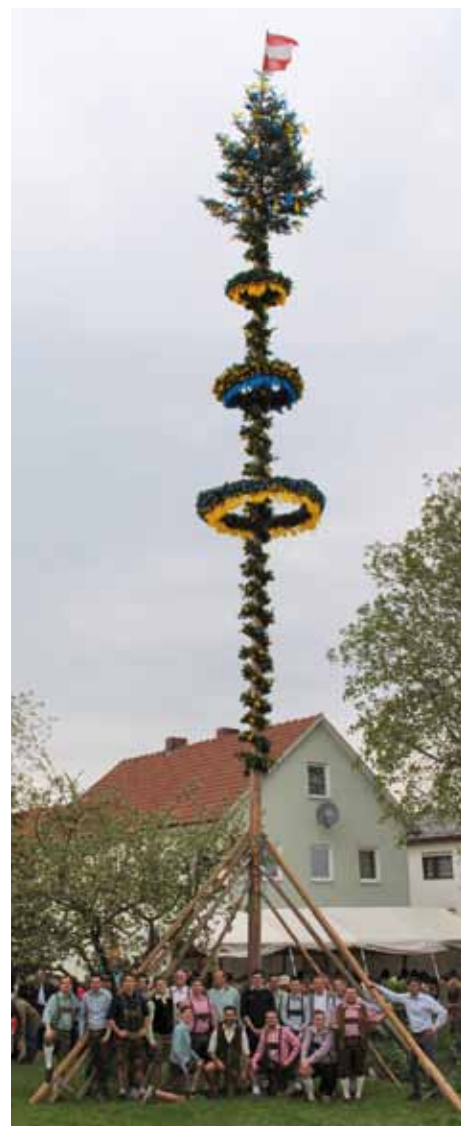
Maibaum der ÖVP Ennsdorf.