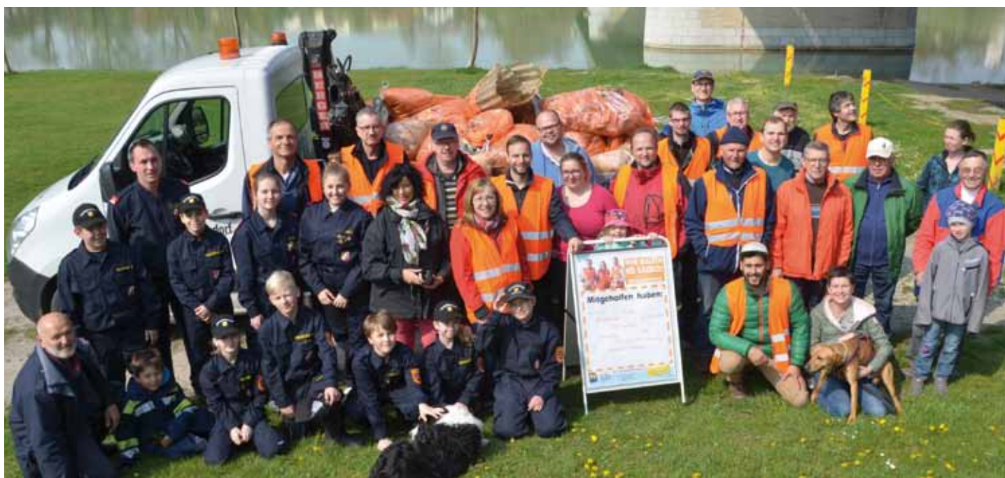
Die fleißigen Müllsammler/innen aus Ennsdorf.

Aus alten PET-Flaschen können Sportschuhe werden, aus Altpapier neue Bücher-Bestseller und aus einer Aluminiumdose könnte ein neues Fahrrad entstehen.