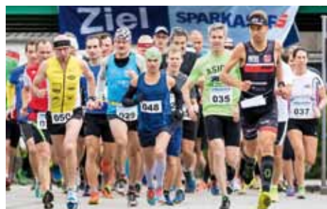
Beim 25. Ennsdorfer Brückenlauf am 28.9.2019 soll auch gefeiert werden.

Schwerpunkt des heurigen Jahres ist der Brückenlauf, der heuer am 28.9. zum 25. Mal stattfindet. Für dieses Jubiläum werden einige Überraschungen geplant. Es soll ein besonderes Event für die LäuferInnen und auch für die Bevölkerung werden.