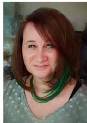
„In Kürze wird es auch eine Facebook Seite zum Nah und Frisch Markt Wang geben“ FB: „Nah&Frisch Wang“

Mehr Infos zu Nah&Frisch, den Aktionen und den Kaufleuten finden sie hier: www.nahundfrisch.at