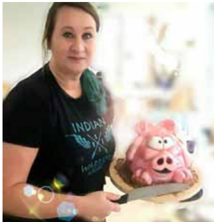
„Mit meinen ausgefallenen Torten konnte ich immer überzeugen“

Es lief gut, also warum sollte ich wieder neu starten und mit etwas Neuem beginnen?