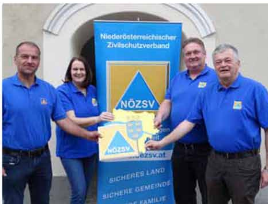
Die Zivilschutzbeauftragten der Gemeinden Wang, Wolfpassing und Steinakirchen:

Das Beste, was Sie machen können, ist auflegen (bzw. das Mail löschen). Noch besser ist, die Polizei zu informieren. Denn 99% dieser Anrufe und Mails sind schlicht und einfach Betrug. Wenn Sie wirklich unsicher sind, ob es nicht doch um einen Verwandten geht, dann legen Sie trotzdem auf. Reden Sie zuerst mit allen anderen Verwandten – auch mit denen, zu denen Sie schon lange keinen Kontakt mehr haben. Und in 99,9 % aller Fälle werden Sie draufkommen: es gibt keinen Notfall!