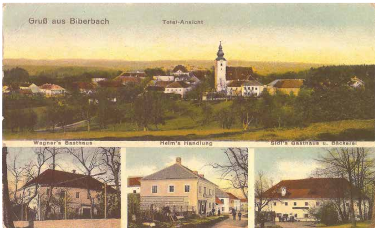
Dorfansicht vor 1912, mit Gasthaus Wagner / Fischer, Kaufhaus Helm / Brunner und Gasthaus Sidl / Kappl

Wer mehr über - damals bei uns in Biberbach - erfahren möchte, kann am Gemeindeamt gerne folgende Bücher erwerben: