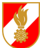
100 Jahre FF-Höfing