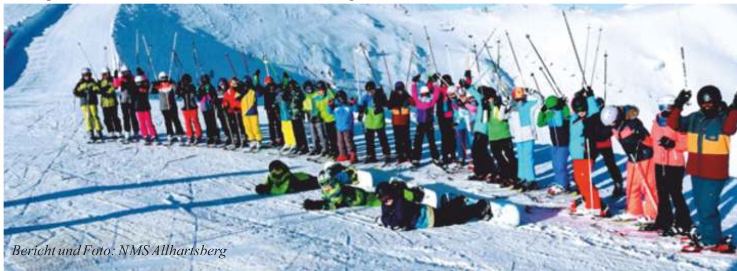
Bericht und Foto: NMS Allhartsberg

Das Wintersportteam der Mittelschule Allhartsberg konnte am Freitagnachmittag die zufriedenen, aber doch etwas erschöpften Schülerinnen und Schüler den Eltern übergeben.