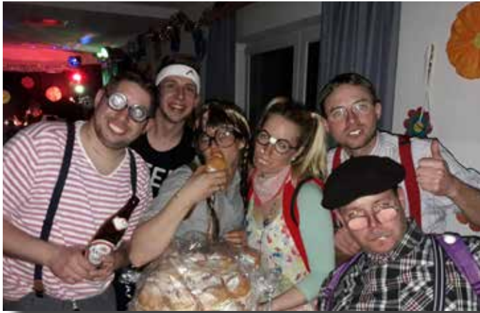
Best Of 70ies