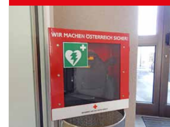
Ortsteil Böhlerwerk – Foyer ehemaliges RAIBA-Gebäude