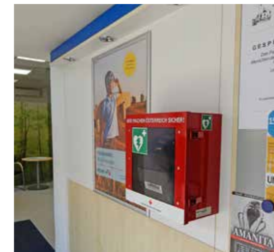
Ortsteil Rosenau – Foyer Sparkasse

Deshalb möchten wir die Standorte in der Marktgemeinde Sonntagberg wieder in Erinnerung rufen: