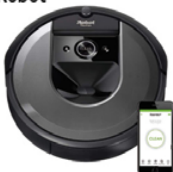
iRobot® Roomba® i7 Saugroboter mit Wi-Fi