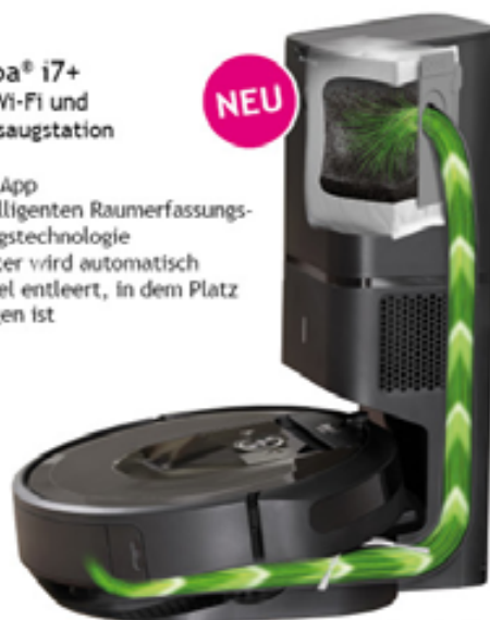
iRobot Roomba i7+

IHR RED ZAC ELEKTROFACHHANDEL IN STEINAKIRCHEN AM FORST. Montag - Freitag 7:30 bis 12:00 Uhr und 14:30 bis 18:00 Uhr, Samstag 7:30 bis 12:00 Uhr