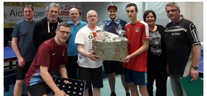
3. Platz: Team Kantine