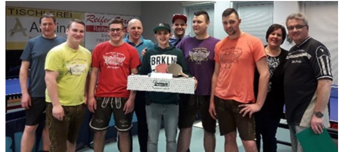
2. Platz : Team Almrausch