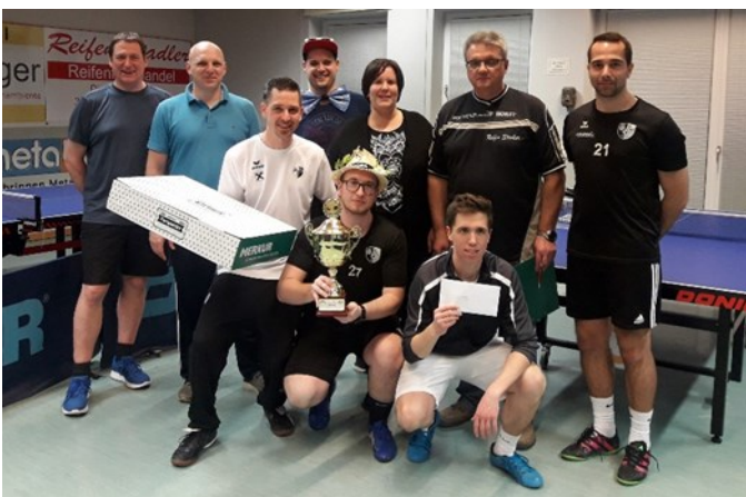
1. Platz: Team Bacardi United

Am Ende wurden noch unter allen Teilnehmern verschiedenste Sachpreise wie zum Beispiel ein 50-L Fass Bier verlost.