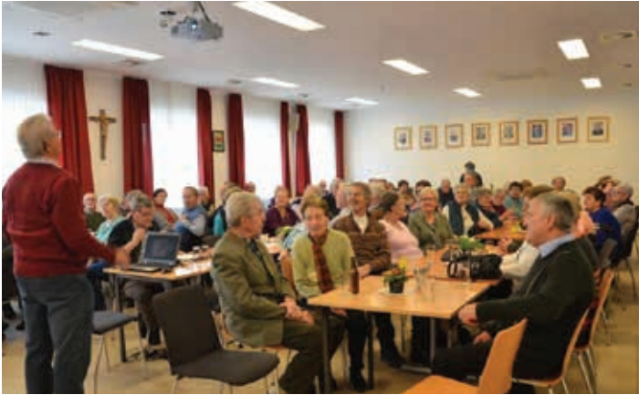
Fotopräsentation vom Seniorenbund im Gemeindezentrum