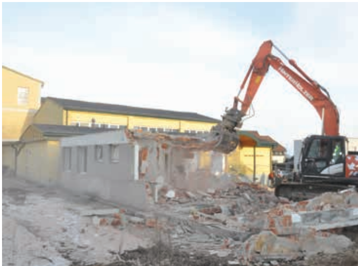
Abbrucharbeiten beim Lehrerhaus