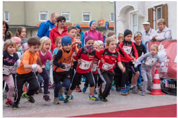
Foto: Die Kinder und Jugendlichen zeigten große Motivation - sie stellten ein überraschend großes Starterfeld dar