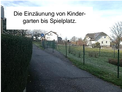
Die Einzäunung von Kindergarten bis Spielplatz.

Im Zuge der Errichtung einer 4. Kindergarten-Gruppe wurde von der zuständigen Behörde des Amtes der NÖ Landesregierung angemerkt, dass die für den Kindergarten zur Verfügung stehende Kinderspielplatzfläche nicht