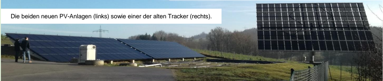
Die beiden neuen PV-Anlagen (links) sowie einer der alten Tracker (rechts).