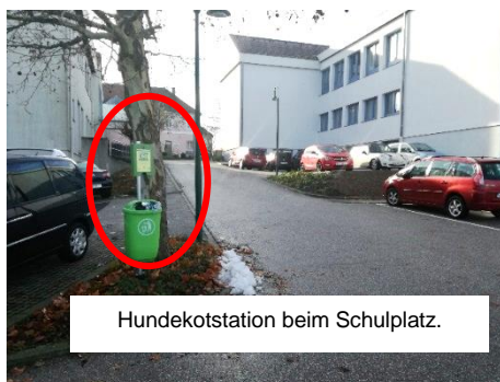
Hundekotstation beim Schulplatz.

welche dieser an öffentlichen Orten im Ortsbereich (...) sowie in öffentlichen Verkehrsmitteln, Schulen, Kinderbetreuungseinrichtungen, Parkanlagen, Einkaufszentren, Freizeit- und Vergnügungsparks, Stiegenhäusern und Zugängen zu Mehrfamilienhäusern und in gemeinschaftlich genutzten Teilen von Wohnhausanlagen hinterlassen hat, unverzüglich beseitigen und entsorgen.“ Bitte bedenken Sie, dass die Gemeindeverwaltung zur Kontrolle der Einhaltung dieser Bestimmung nicht die Hundehalter und deren Hunde beim Spazieren auf Schritt und Tritt verfolgen kann - es wird daher an alle Hundehalter appelliert, im Sinne eines auf andere rücksichtnehmendes