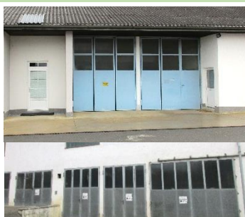
Sind ständig freizuhalten: Gemeindegaragen im Posthof und in der Limbachstraße.

Während des gesamten Jahres (vor allem in den Wintermonaten) sind die Garagentore des Bauhofes (entlang Limbachstraße sowie im Posthof) ständig frei zu halten , da sonst die Schneeräumfahrzeuge bei Schneefall bzw. Glatteis nicht zeitgerecht ausfahren können. Parkende Autos werden kostenpflichtig abgeschleppt.