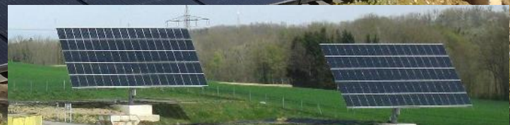
Die beiden „alten“ PV-Tracker vor dem Sturm.