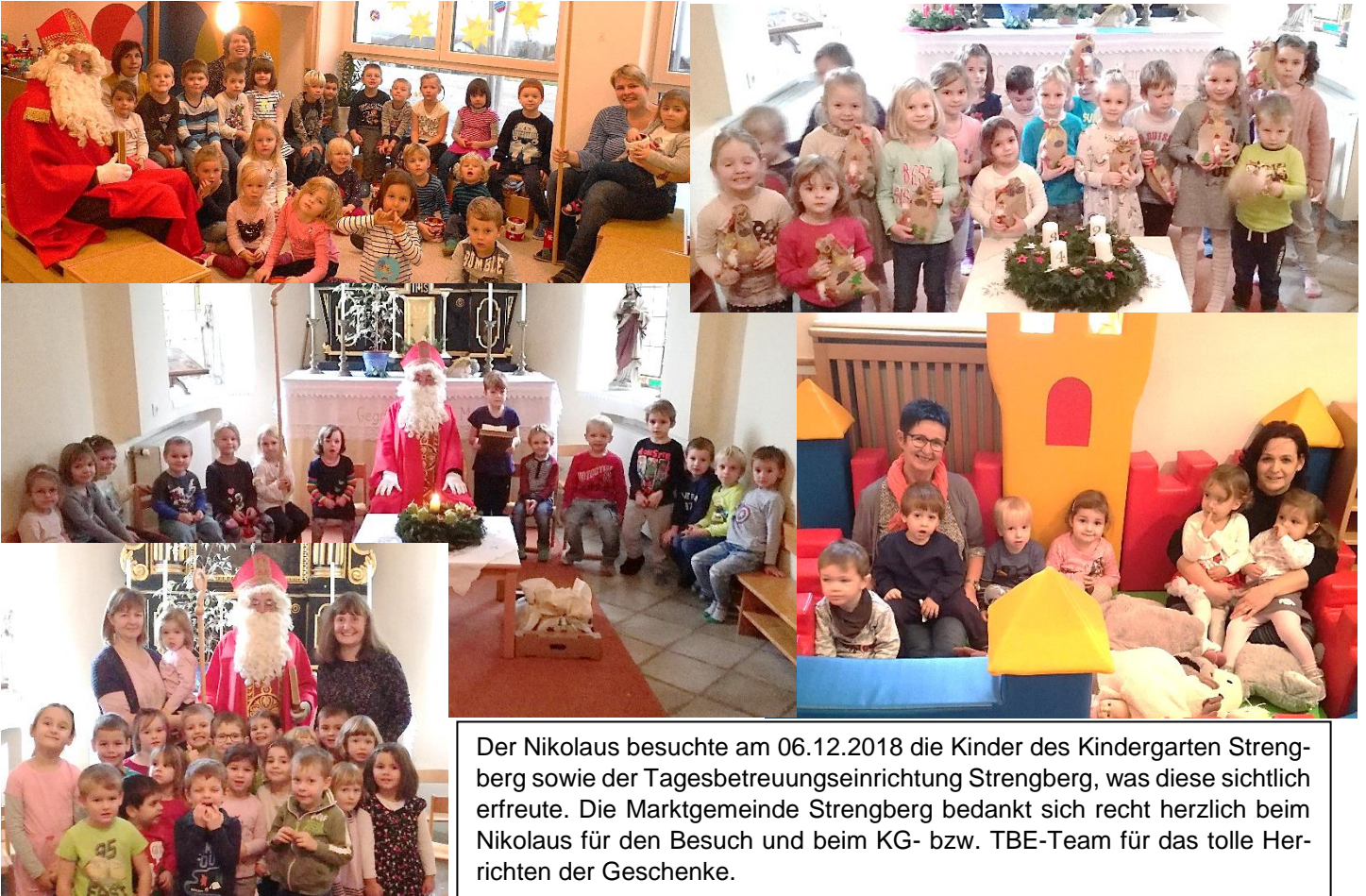
Der Nikolaus besuchte am 06.12.2018 die Kinder des Kindergarten Strengberg sowie der Tagesbetreuungseinrichtung Strengberg, was diese sichtlich erfreute. Die Marktgemeinde Strengberg bedankt sich recht herzlich beim Nikolaus für den Besuch und beim KG- bzw. TBE-Team für das tolle Herichten der Geschenke.