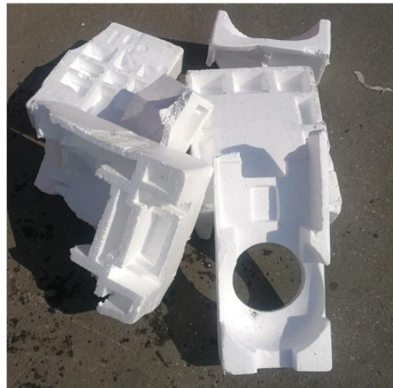
Bitte nur Styropor Verpackungsteile, sauber und ohne Klebebänder zum ASZ

Am ASZ wird das Verpackungsstyropor lose übernommen und ist in den entsprechenden Sammeleinrichtungen vom Anlieferer nach dem Zerbrechen einzubringen. Bitte beachten Sie, dass wir verpacktes Verpackungsstyropor in Säcken nicht übernehmen! Die Sammlung von Verpackungsstyropor bietet auch die Möglichkeit ein sortenreines Recycling durchzuführen. Daher ist das Übernahmepersonal am ASZ angewiesen, eine genaue Kontrolle durchzuführen. Die sortenrein gesammelten Verpackungskunststoffe werden direkt vom ASZ zum stofflichen Recycling transportiert.