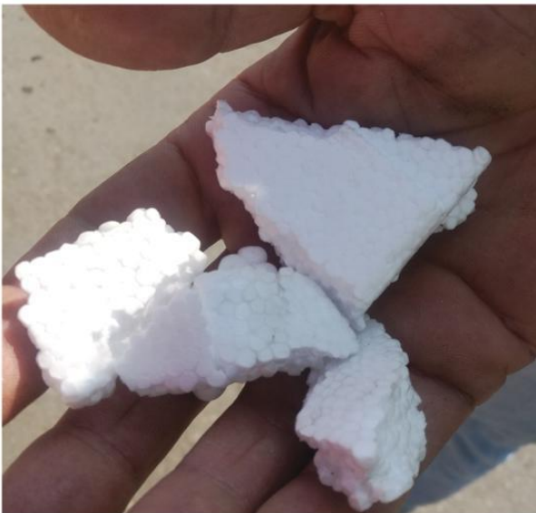
Styropor mit Kugelstruktur kann gut recycelt werden

Ab 1. Oktober 2018 gibt es an den Altstoffzentren des GDA die Möglichkeit, Styroporverpackungen abzugeben. Dabei geht es um Verpackungen aus Formstyropor, leicht zu erkennen daran, dass beim Brechen Kugelstrukturen entstehen. Damit ist sichergestellt, dass bei kurzfristigem großen Anfall von Verpackungsstyropor wie zum Beispiel beim Kauf von geschützten Elektrogeräten, eine Alternative zur Sammlung in den Gelben Säcken zu Hause besteht. Verpackungsstyropor in Form von Chips und Streifen ist nach wie vor über den Gelben Sack zu entsorgen.