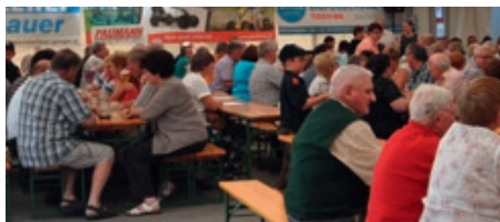
Der Gemeindeseniorentag findet am 1. September 2018 statt.

Die Marktgemeinde St. Georgen am Ybbsfelde lädt alle Frauen und Männer ab dem 60. Lebensjahr mit deren