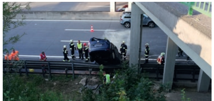
Ein Auto stürzte im Bereich einer Brücke auf die Autobahn.

Weiters gab es diverse Brände und PKW Bergungen, aber auch eine Menschenrettung Ende Juli. Aus unbekannter Ursache kam ein PKW von der Fahrbahn kurz vor der Autobahnüberführung von Viehdorf Richtung Seisenegg ab und stürzte auf die A1. Das Auto blieb in den Leitschienen hängen. Der leicht verletzte Fahrer konnte von den Ersthelfern geborgen werden. Durch herabfallende Beton-teile wurden jedoch weitere Autos beschädigt und die Auf-räumarbeiten erschwert.