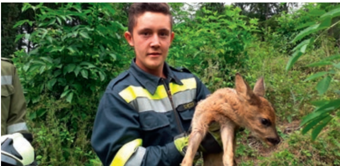
Im Juni kam es zu einer Tierrettung, bei welcher ein Rehkitz aus einem Betonschacht gerettet werden konnte.

Wir verwöhnen Sie bereits am Samstag, 1. September ab 13:00 Uhr beim Seniorennachmittag der Marktgemeinde St. Georgen am Ybbsfelde mit Köstlichkeiten aus unserer drei Sterne-Küche. Weiter geht es am Abend ab 21:00 Uhr mit Livemusik der Cover-Band „Highlights“ bei freiem Eintritt bis 21.30 Uhr . Am Sonntag, 2. September spielt für Sie der Musikverein Viehdorf ab 10:00 Uhr beim Frühschoppen auf. Im Anschluss wird uns die Band „BGB bagoadnblech“ mit ihrem Können begeistern. Hierbei haben sich Jungmusiker aus Ferschnitz und Kollmitzberg zu einer feurigen Blech-Musikgruppe der modernen Art zusammengefunden. Ich freue mich, Sie alle begrüßen zu dürfen. Für etwaige Lärmbelästigungen möchte ich mich vorweg bei Ihnen entschuldigen. Wir sind bemüht, ein ruhiges und gemütliches Fest mit Ihnen zu feiern. Danke für Ihr Verständnis!