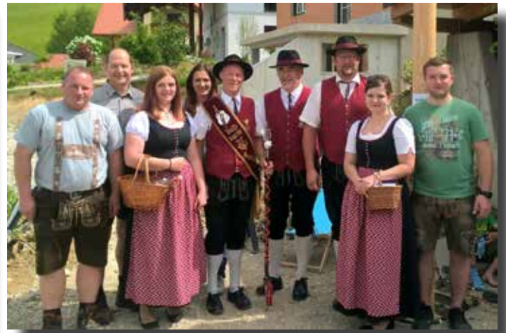
Musikalischer Weckruf am 1. Mai