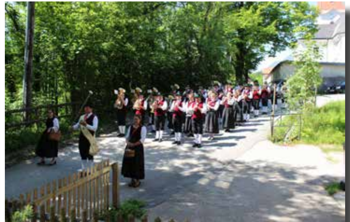
Tag der Blasmusik