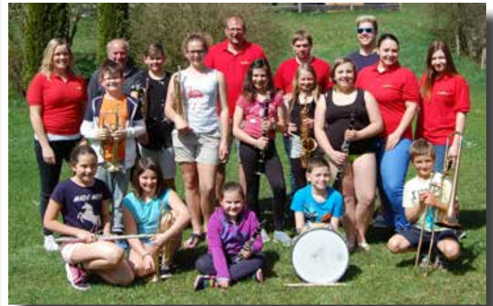
Jungmusikertag Blasmusik Kogelsbach