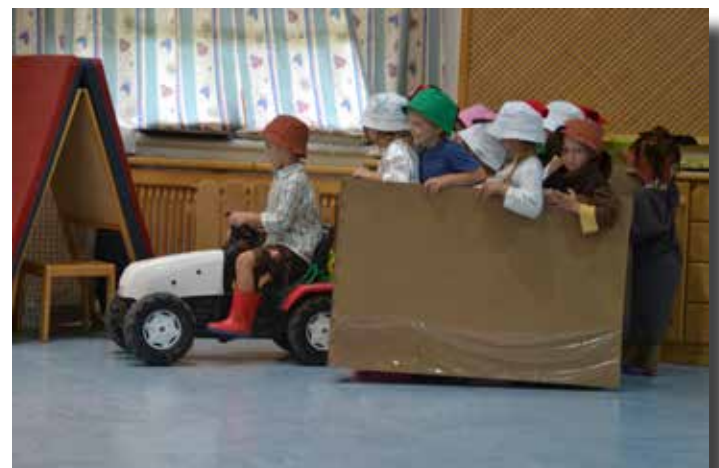
Kindergartenabschlussfest mit Musicalaufführung Nr. 2 Juli 2018 gemeindenachrichten st.georgen am reith