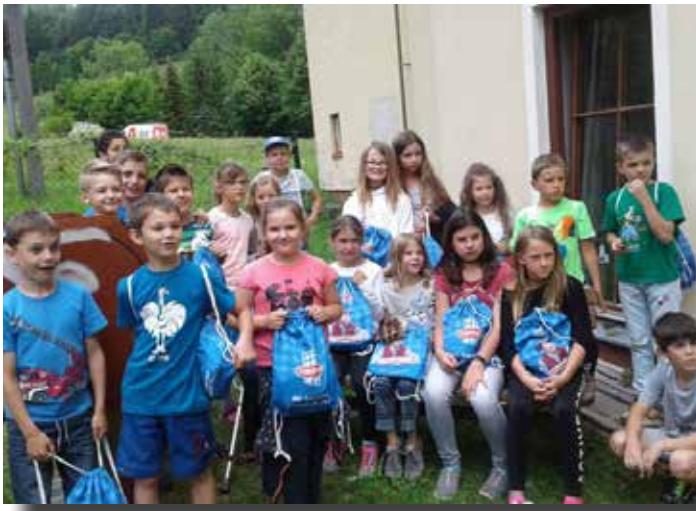
Mili on Tour