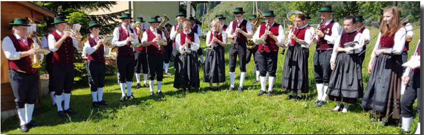
Musikverein St. Georgen am Reith - Tag der Blasmusik