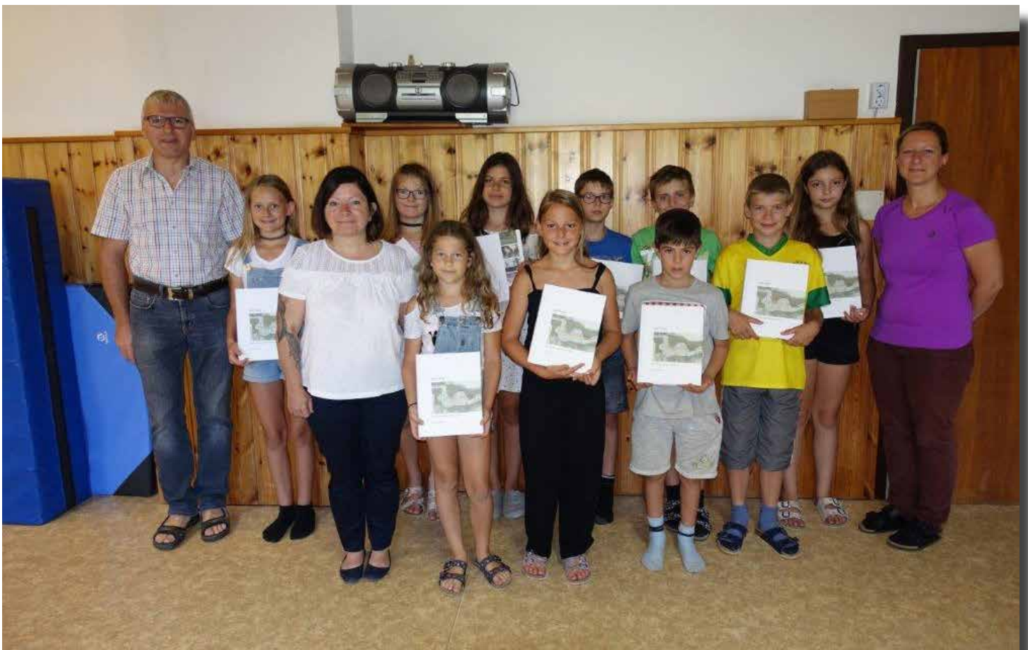
Schulabgänger der Volksschule St. Georgen am Reith Nr. 2 Juli 2018 gemeindenachrichten st.georgen am reith