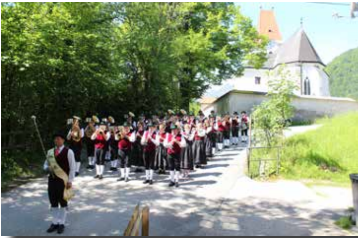
Tag der Blasmusik-Mitgestaltung der Messe