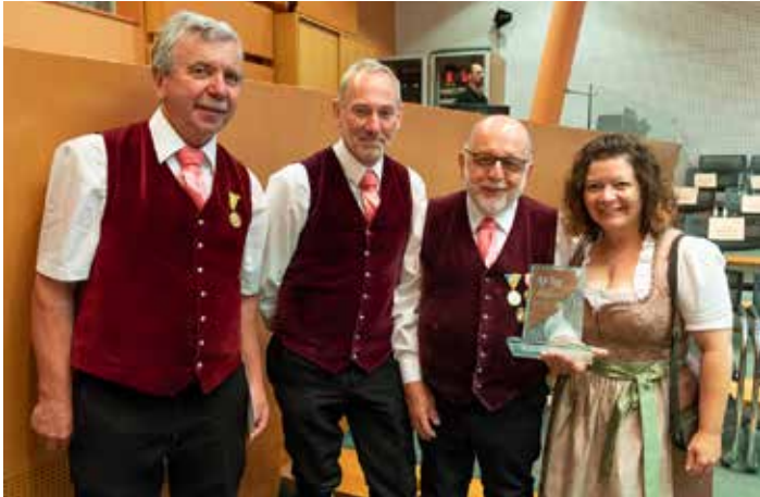
Ehrenpreis der Landeshauptfrau in Bronze