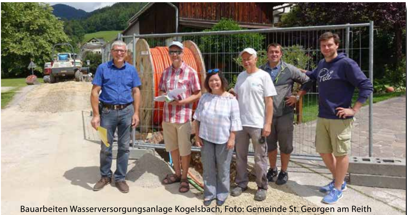
Bauarbeiten Wasserversorgungsanlage Kogelsbach