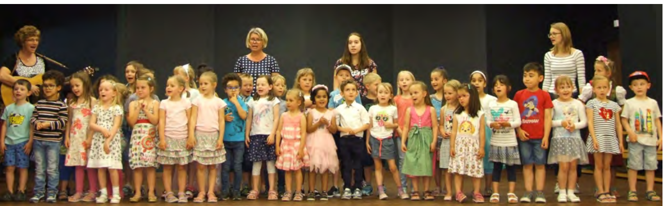
Foto: Die Kindergartenkinder sangen von „Hello Family“ und wie lieb sie ihre Mütter haben