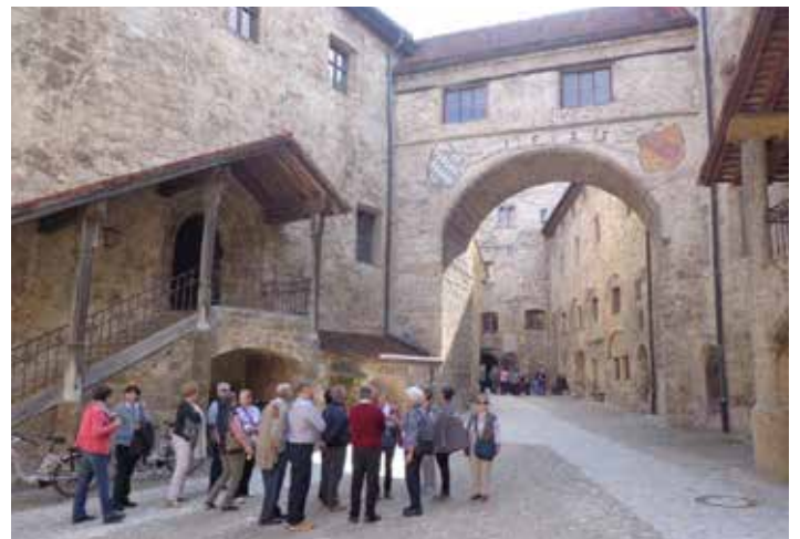
bei der Führung auf der Burganlage

Bericht: Eva Stöger