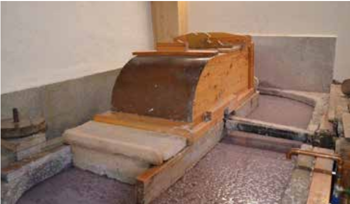
Der Holländer, in dem die Hadern gemahlen werden

wurden. Nach einem kurzen Spaziergang in Bad Großpertholz fuhren wir über Arbesbach, Altmelon und Grein zur Abschlußjause ins Gasthaus Parlament in Stephanshart.