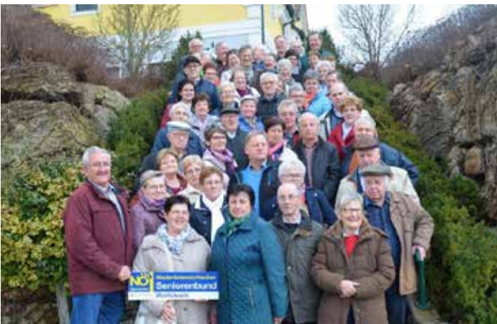
Gruppenfoto vor dem GH Parlament