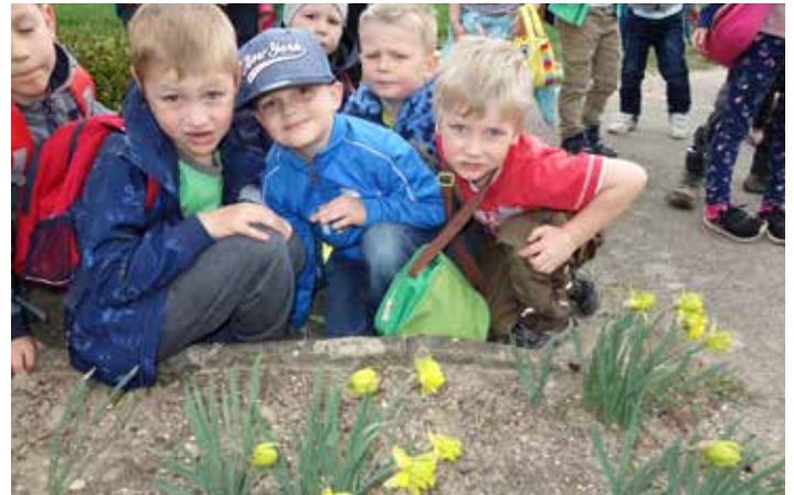
Wir entdeckten die ersten Blumen

Die Kinder erlebten im Frühling, wie das Leben neu erwacht und alles zu wachsen begann.