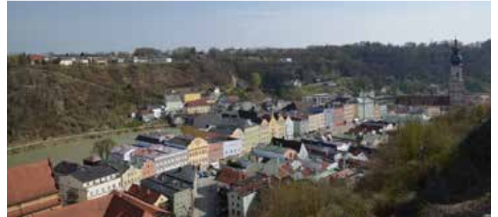
Blick von der Burg auf die Stadt Burghausen

Post zu Mittag gegessen haben. Gut gestärkt blieb noch Zeit den Hauptplatz dieser Stadt mit ihren eindrucksvollen Häusern anzusehen. Mit den zwei Bussen ging es zur Burganlage Burghausen. Bei der Führung durch die über einen Kilometer lange Burganlage durchwanderten wir die sechs Burghöfe und erfuhren Interessantes über die Geschichte und die Baukunst des Mittelalters dieser weltlängsten Burg. Bei der Rückfahrt konnten wir uns nach diesen vielen Eindrücken gut ausruhen um dann im Gasthaus Pfistermüller in St. Florian zur abendlichen Jause einkehren.