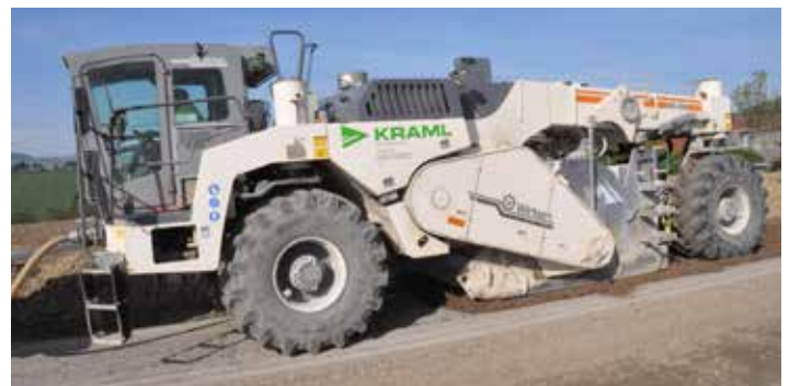
Asphaltfräsmaschine im Einsatz