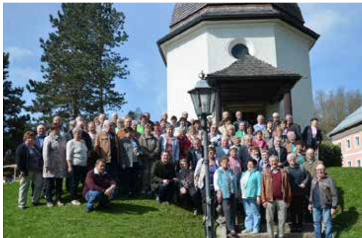
Gruppenfoto bei der „Stille-Nacht-Kapelle“