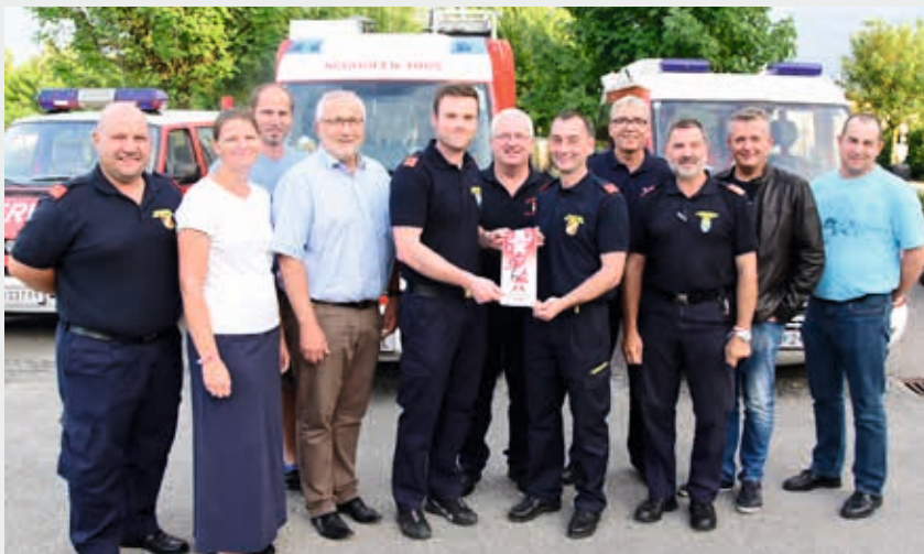
Übergabe des Lagerwimpels an die Veranstalter-Feuerwehr 2018 aus der Gemeinde St. Aegydt am Neuwalde

Anfang Juli standen in der Ostarrichi Gemeinde tausende Feuerwehrjugendliche im Mittelpunkt. Rückblickend darf ich der Neuhofner Feuerwehr eine perfekte Organisation des Jugendtreffens bescheinigen und einen herzlichen Dank für den großartigen Einsatz aussprechen. Man spürte auch den guten Zusammenhalt in der Bevölkerung und den Vereinen.