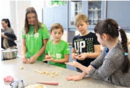
Beim Kekse backen

Bibliothek, den Multimediaraum und den Werkraum. Auch in Englisch und Mathematik lernten sie etwas Neues dazu.