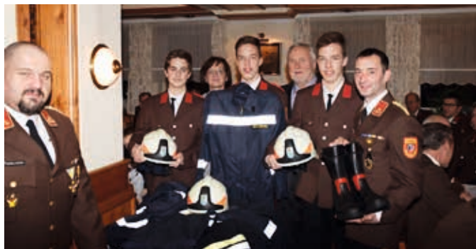
Die neuen FF-Mitglieder wurden mit Einsatzbekleidung ausgestattet.