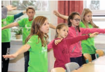
English is fun!