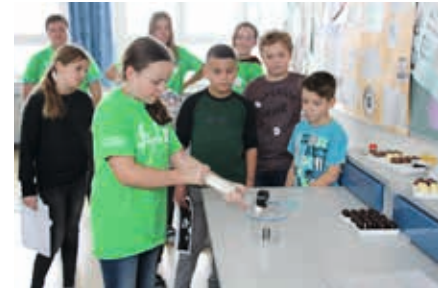
Experimente in Physik