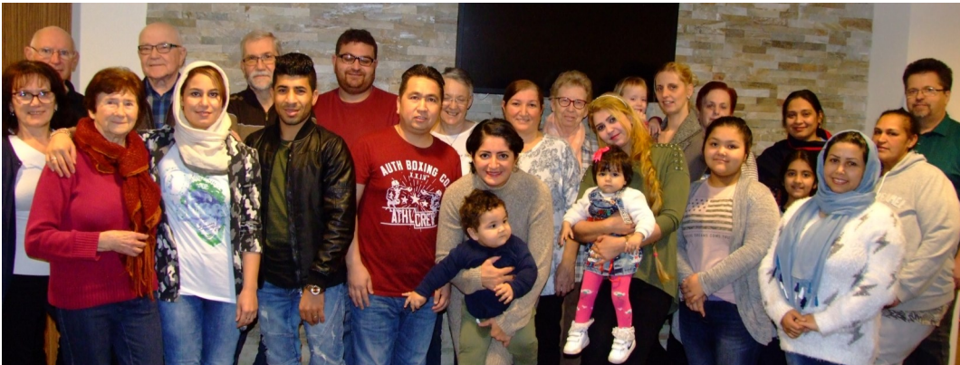
Foto: Integrationsgemeinderätin Duygu Yilmaz-Binici (Bildmitte) freut sich über die Integrationsbereitschaft der Kematner Asylwerber

Dieses „come together“ von der Initiative „Willkommen Mensch“ bietet Menschen verschiedenster Kulturen und Nationen die Gelegenheit, in gemütlicher Atmosphäre Ideen und Meinungen auszutauschen sowie persönliche Kontakte zu knüpfen. Ziel ist es, Strukturen zu entwickeln, die einerseits eine Betreuung und Hilfestellung bedürftiger Menschen im Lebensalltag ermöglichen und andererseits eine Integration ins Gemeindeleben fördern.