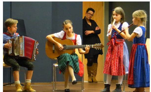
Schüler des Musikschulverbandes begleiteten die Veranstaltung musikalisch