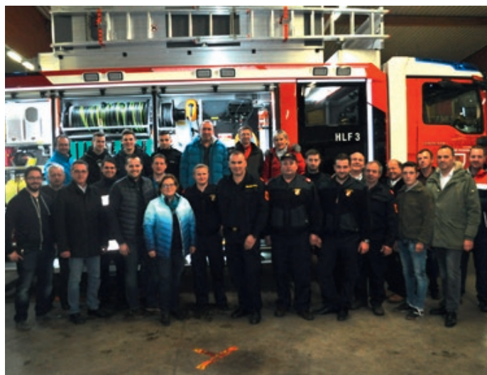
Am 7. Dezember 2017 wurde das Tanklöschfahrzeug HLF3 von der Fa. Rosenbauer nach St. Georgen/Y. überstellt.

Die Freiwillige Feuerwehr St. Georgen/Y. ist mittlerweile eine der größten Wehren im Abschnitt Amstetten-Land. Unser Einsatzgebiet umfasst 23 km 2 , 2849 Einwohner (Stand 2016), einen Flugplatz, die Autobahn zwischen Amstetten West und Ost, eine lange Eisenbahnstrecke und mittlerweile einen immer größer werdenden Industriepark. Wenn man sich das einmal genau überlegt, wie groß St. Georgen mittlerweile ist, wird einem auch klar, wieviel Mehraufwand die freiwilligen Feuerwehrmänner/