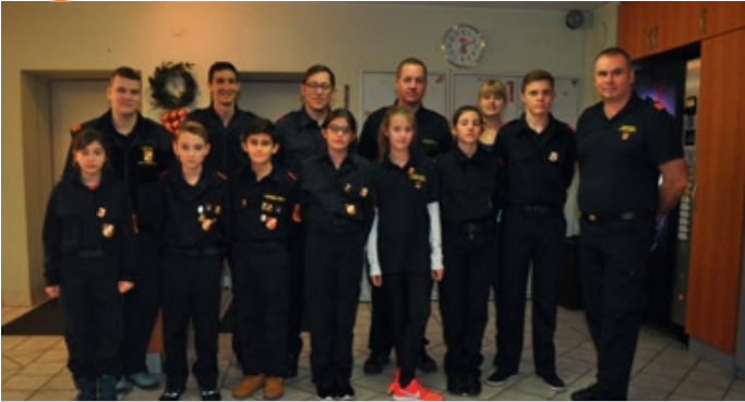
Mitglieder der Feuerwehrjugend nach erfolgreicher Ablegung der Erprobung.