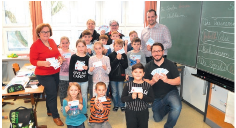
Der Volksschule wurden Liftkarten für die Forsteralm übergeben. Damit soll im Februar ein Schitag organisiert werden.

Wohnen ist eines der wichtigsten Grundbedürfnisse unseres Lebens und ich wünsche allen Bewohnern, dass sie Ruhe, Geborgenheit und Kraft für den Alltag in ihrem Heim finden.