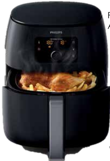
Philips Airfryer XXL