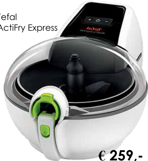
Tefal ActiFry Express