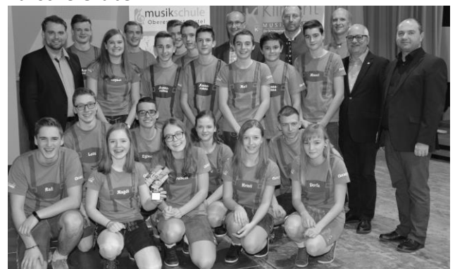
Tageshöchstwertung beim Jugendblasorchesterwettbewerb für die „Lederhosenböhmische XL“!

Das Jahr 2018 wird gleich mit drei tollen Gastkonzerten eingeläutet: Am Sonntag, den 14. Jänner gastiert „The New Austrian Big Band 2.0“ unter der Leitung von Günter Hagauer ab 18.00 Uhr in der Franz-Eglseer-Turnhalle in Ernsthofen. Eine Woche später folgen im Gerti-Lischka-Saal großartige Abende mit der Anton-Bruckner-Privatuniversität Linz. Am Samstag, den 20. Jänner beehrt uns um 18.00 Uhr die Gesangsklasse und am Montag, den 22. Jänner 2018 sorgt die Klarinetten-Klasse um 18.00 Uhr für musikalische Grüße.