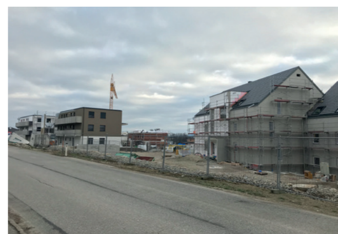
Errichtung von Wohnungen in Kansering