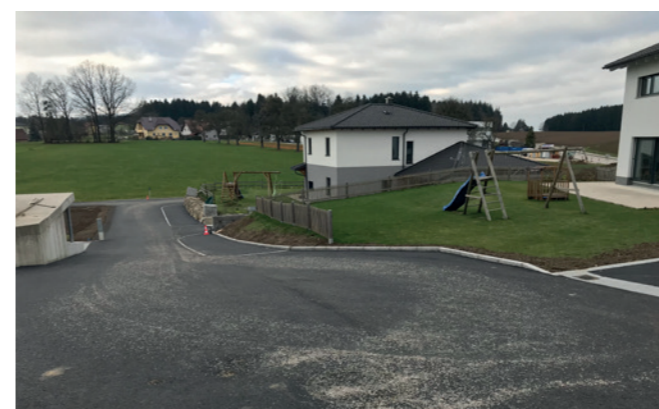
Fertigstellung der Wiesenstraße

Liebe Mitbürgerinnen und Mitbürger, auch dieses Jahr hat wieder gezeigt, dass wir auf den Einsatz und die Leistungsfähigkeit, auf den Ideenreichtum und den Zusammenhalt in Seitenstetten bauen können. Deshalb haben wir guten Grund, mit Zuversicht in das neue Jahr zu blicken.