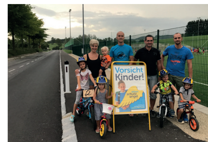
Geh- und Radweg Dachsbach