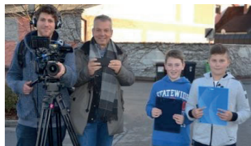
Schule im Aufbruch