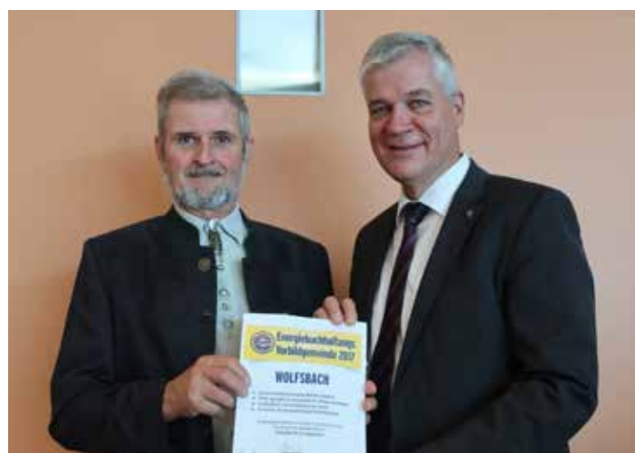
Auszeichnung der Marktgemeinde Wolfsbach für „Energiebuchhaltung Vorbildgemeinde 2017“.