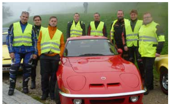
Gruppenbild Opel GT Ausfahrt

Zusätzlich zum Cabrio-Club Wolfsbach übernehmen die MFW gemeinsam mit der Polizei auch die Straßensicherung für die vom ÖAMTC organisierte Opel GT Ausfahrt am 16. September.