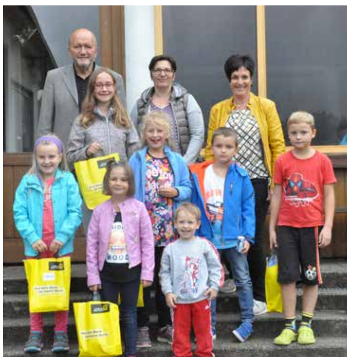
Die Gewinner des Ferienspiels.