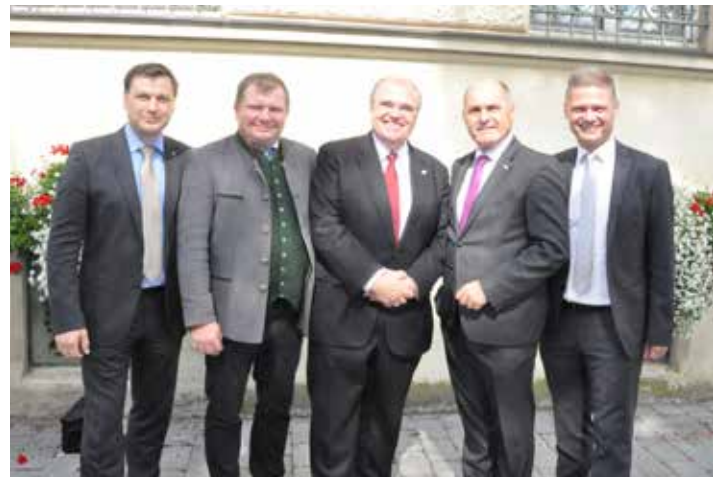
Spatenstichfeier für den Umbau des Bezirksgerichts Haag mit Vizekanzler Wolfgang Brandstetter.