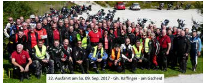
Gruppenbild 22. Ausfahrt

9. September auf zur Herbstaufahrt. Pünktlich wie immer ging es um 07:30 Uhr für 76 Biker auf ihren 65 Motorrädern auf die in 4 Etappen aufgeteilte 310 km lange Tour. Auch diesmal konnte dank der hohen Disziplin aller Beteiligten und dem Einsatz der gelben Engel eine unfallfreie Ausfahrt verzeichnet werden. Unfallfrei, aber nicht ganz ohne Hoppala. Ein Biker tankte Diesel statt Benzin. Gott sei Dank handelte es sich dabei um einen der erfahrensten Motorradschrauber. Mit nur ein paar Handgriffen war der Tank abgebaut und entleert. Und noch bevor alle mit tanken fertig waren war das Motorrad schon wieder einsatzbereit.