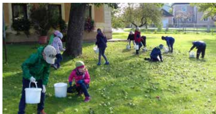
2A beim Herbst –Obstklaub-Wandertag