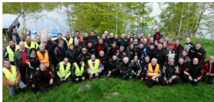
Gruppenbild 21. Ausfahrt

Der April wurde 2017 seinem Namen wieder einmal gerecht. So fiel die am 29. April geplante Ausfahrt buchstäblich ins Wasser und der Ersatztermin musste wahrgenommen werden. Am 6. Mai war der Wettergott allerdings gnädig und die Sonne kam seit langem wieder mal zum Vorschein. Auf dieser insgesamt 303 km langen Ausfahrt begleiteten uns 73 Personen auf 63 Motorrädern. Als Highlight bei dieser Ausfahrt kann wohl erwähnt werden das wir mitten auf der Strecke auf die Ausfahrt des in Mautern stattgefunden Vespa-Treffens getroffen sind. Unsere Wege kreuzten sich und dabei führte eine Kreuzung beinahe zum Chaos. Eine Gruppe wollte nach rechts, die andere nach Links und keiner wusste mehr so recht, und wo muss ICH hin? Wem muss ich folgen? Aber durch unsere routinierten Gelben Engel und der Disziplin aller Biker schafften wir auch diese Hürde mit einem Lächeln auf den Lippen.