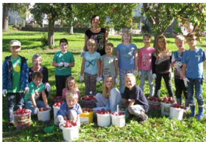
2B beim Obstklauben