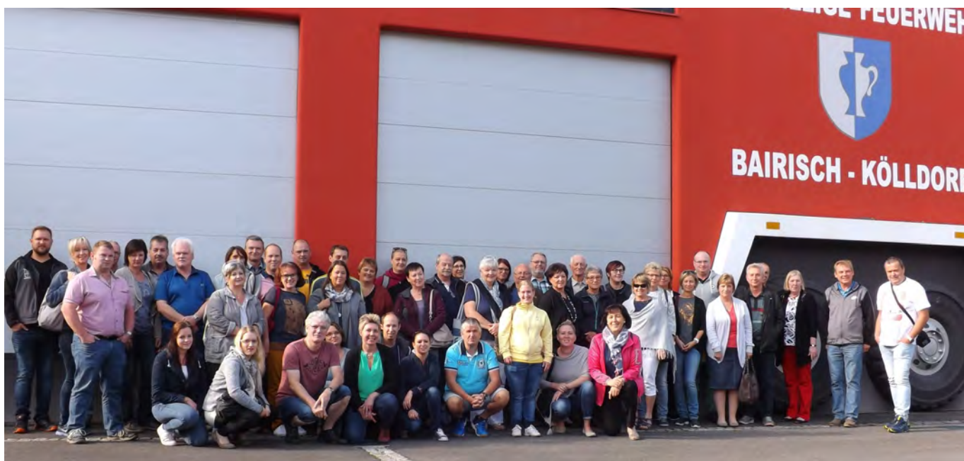
Foto: Das Highlight einer interessanten Führung durch die Gemeinde Bairisch Kölldorf - das einem Feuerwehr-auto nachempfundene Zeughaus