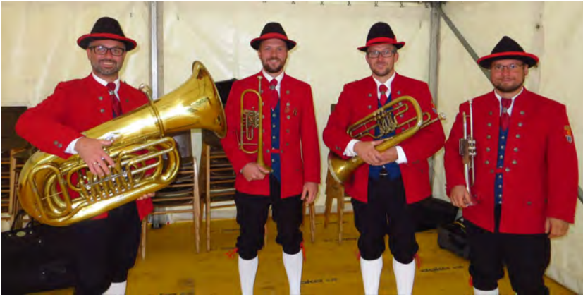
Die gelungene musikalische Umrahmung durch ein Ensemble des Musikvereines Hilm-Kematen verlieh dem Markt fest einen festlichen Charakter