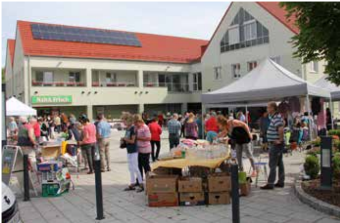
Reges Interesse beim Kramermarkt 2017 der wie alljährlich am Pfingstmontag stattgefunden hat.