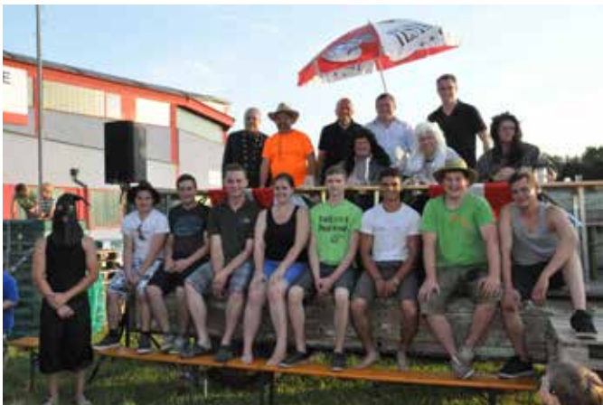
Foto nach der „Gerichtsverhandlung“ - zurückbringen des gestohlenen Maibaumes nach St. Johann.