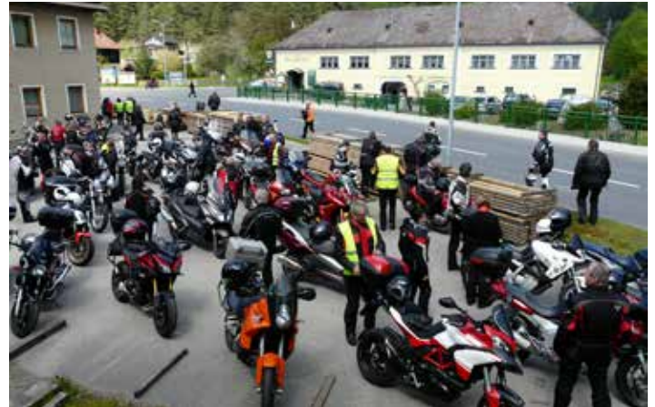
Motorrad-Gruppenbild 21. Ausfahrt

Auch diesmal möchten wir uns wieder recht herzlich bei den Gelben Engeln für ihre Unterstützung bedanken und vor allem bei allen Bikern für die hohe Disziplin während der gesamten Ausfahrt. So konnten wir auch die 21. Ausfahrt unfallfrei abschließen.