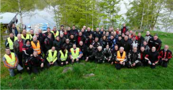
Gruppenbild 21. Ausfahrt