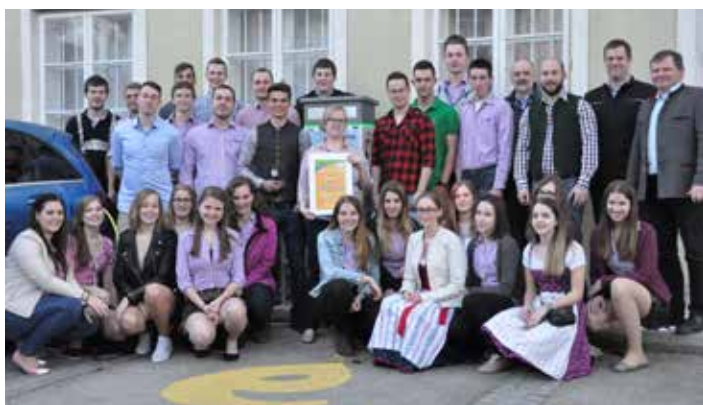
Herzliche Gratulation unserer Landjugend! 6. Platz von 76 Gruppen und Auszeichnung in Gold.