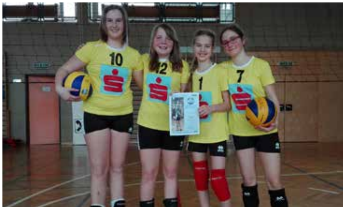
1. Platz der NMS Wolfsbach bei der Bezirksmeisterschaft. Herzliche Gratulation!