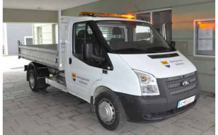
Der neue Transporter der Marktgemeinde Wolfsbach.