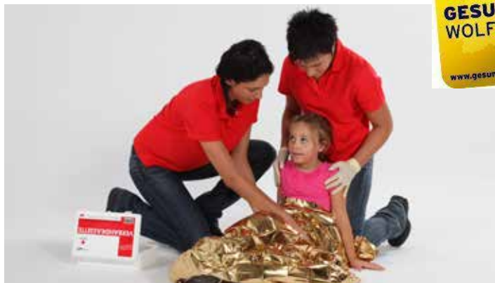
Erste Hilfe Auffrischkurs