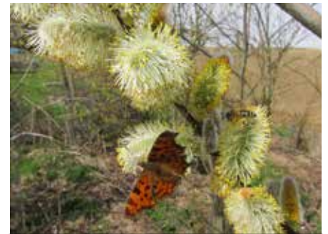
Die Weidenkätzchen sind die erste und wichtigste Pollenquelle im Frühjahr und - nicht nur bei den Bienen – sehr begehrt.

Der Imkerverein Wolfsbach freut sich immer über Interessenten, die vielleicht einmal mit der Imkerei beginnen wollen und konkrete Informationen brauchen (oder einfach einmal zuschauen wollen). Melden sie sich bei unserem Verein!