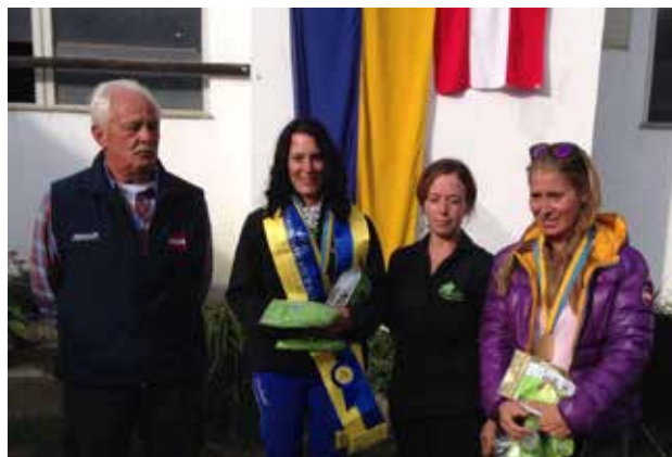
Bericht: Raphaella Schmid