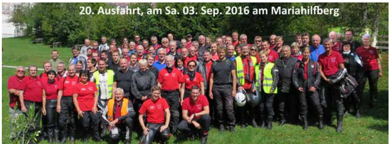
Gruppenbild 20. Ausfahrt