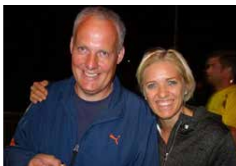
Bericht: Doris Schachner