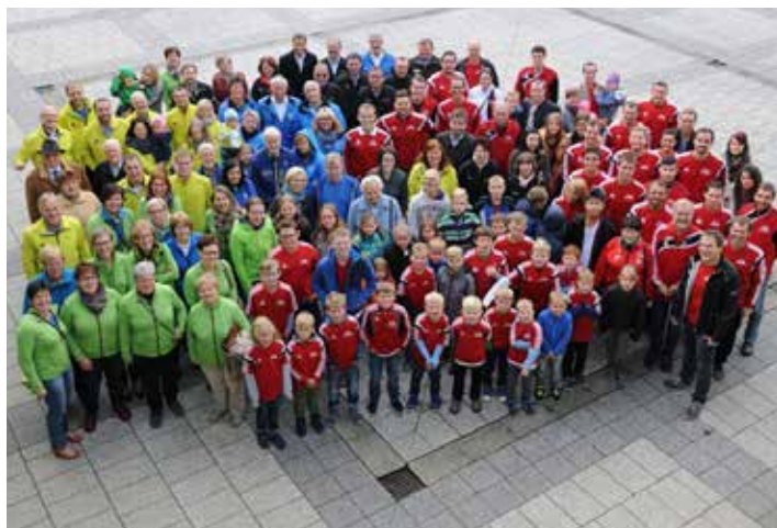
Bericht: Doris Schachner

Es ist immer wieder schön zu sehen, wie groß das Bewusstsein, in der Wolfsbacher Bevölkerung, für Gesundheit durch Sport und Zusammenhalt von klein bis groß, gelebt wird!