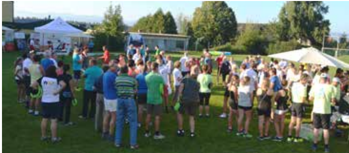
Morgendlicher Benefizlauf mit 123 Teilnehmern.