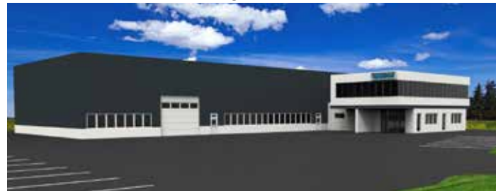
So wird die Betriebshalle der Firma Systron im Gewerbegebiet Ost in Wolfsbach nach der Fertigstellung aussehen.

Sehr erfreulich ist, dass sich nach langer Zeit wieder eine Firma in Wolfsbach ansiedelt. Die Firma Systron, die derzeit noch ihren Standort in den Hörmannhallen im Gewerbepark Seitenstetten hat, wird nach Wolfsbach übersiedeln. Das Unternehmen, das Maschinen für die Glasbearbeitung herstellt, wurde vor drei Jahren von zwei Wolfsbachern gegründet. Die Halle, die ihnen in Seitenstetten derzeit zur Verfügung steht, ist zu niedrig, deshalb haben sie sich zu einem Neubau entschlossen. Ende Oktober werden schon die Bauarbeiten beginnen. Die Gemeinde beabsichtigt das Areal rasch aufzuschließen. Die Firma Systron wird 2017 den Betrieb aufnehmen. Langfristig sollen dort 20 Mitarbeiter beschäftigt werden.