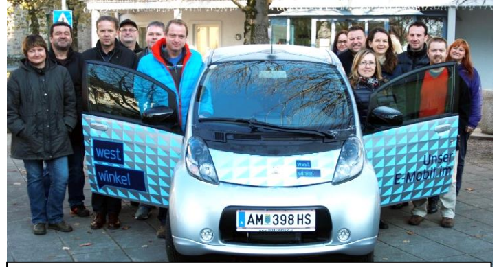
Das kostenlos auszuleihende E-Auto mit Westwinkelvertretern.

Eine Anmeldung ist ab sofort direkt am Gemeindeamt bzw. telefonisch (Tel.: 07432/2214) möglich.