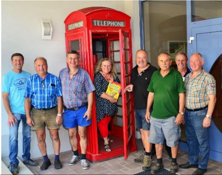
Die neue Minibibliothek und die fleißigen Helfer - Vielen Dank!

Mit tatkräftiger Unterstützung einiger Strengberger ist es gelungen, eine original englische Telefonzelle nach Strengberg zu bringen. Der Lesekreis konnte diese Telefonzelle ausfindig machen. Sie wurde bereits im Eingangsbereich der Volksschule Strengberg aufgestellt und soll als Minibibliothek für JUNG und ALT dienen ( alle Interessierten - auch Nicht-Schüler - können sich dort Bücher gratis ausleihen). Für Bücherausleihungen steht natürlich auch weiterhin das bewehrte Team der Pfarrbücherei Strengberg zur Verfügung.