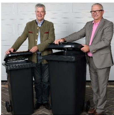
Der GDA mit den neuen Tonnen.

Die MEKAM-Tonne (eine Tonne mit Trennvorrichtung zur Entsorgung von Rest- und Bioabfall) hat das Ende ihres Einsatzzeitraumes erreicht und wird nun im Herbst 2017 durch neue, separate Tonnen für Rest- und Bioabfall ersetzt. Alle betroffenen Haushalte in der Gemeinde wurden bereits mit einem persönlich adressierten Schreiben vom Gemeinde Dienstleistungsverband Region Amstetten (GDA - Zuständig in Strengberg sowie im Bezirk Amstetten für Müllentsorgung) darüber informiert. Die Tonnenumstellung erfolgt auf Idee und Umsetzung des GDA.