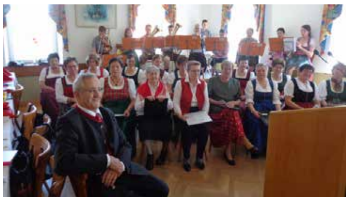
Seniorenchor und Jugendblasorchester