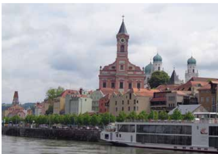
Fotos von Passau