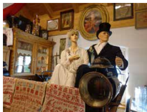
Ausstellung im Nadlingerhof