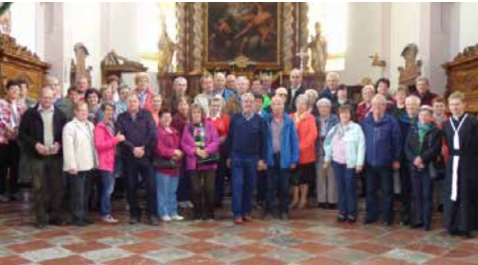
Gruppenfoto in der Stiftskirche