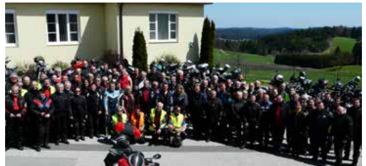
Gruppenbild 19. Ausfahrt Frühjahrsausfahrt 2016:

Bei kühlen 6.5 Grad starteten die Motorradfreunde