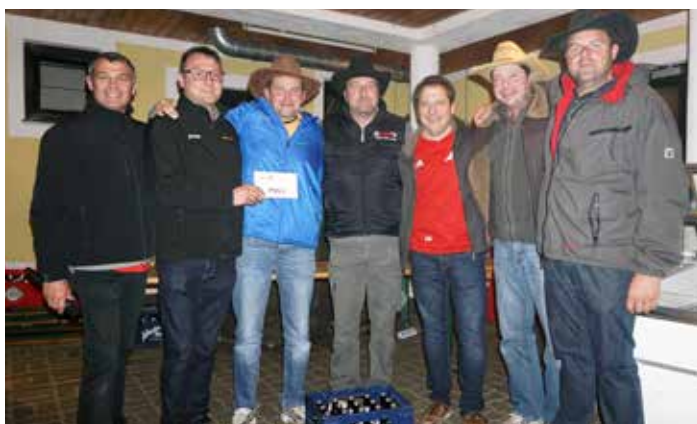
Ortsmeister 2016 – Asphaltcowboys

Erstmals bei der Ortsmeisterschaft gab es dieses Jahr ein Würfelspiel mit tollen Preisen. Der erste Platz war eine Speckjause und ein Gutschein im Gesamtwert von 65 €. Der zweite und dritte Platz