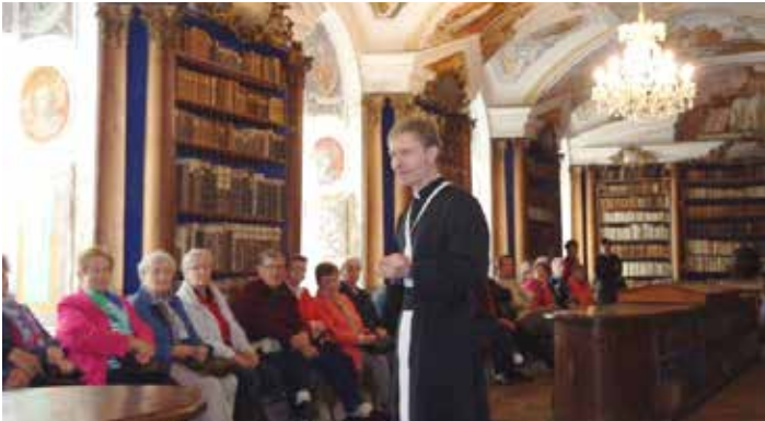
Stift Reichersberg: in der Bibliothek und