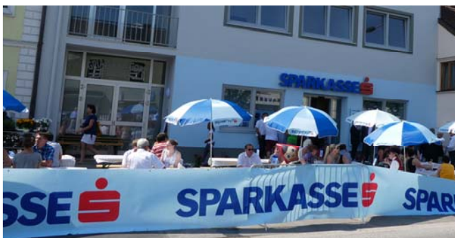
links: Die Besucher erfreuten sich der neuen Filiale.