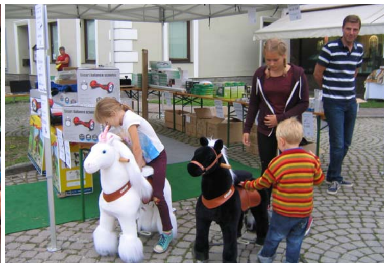
Auch für die kleinsten Besucher war der Besuch des „Gewerbe-Sommers“ ein tolles Erlebnis.

Geschäftsstelle des Ortsentwicklungs-Vereines „GEMEINSAM für Blindenmarkt“