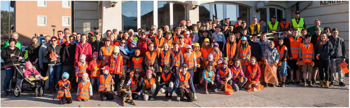
Foto: Gemeinsam für Kematen - Jung und Alt half mit, unseren Naherholungsraum zu säubern