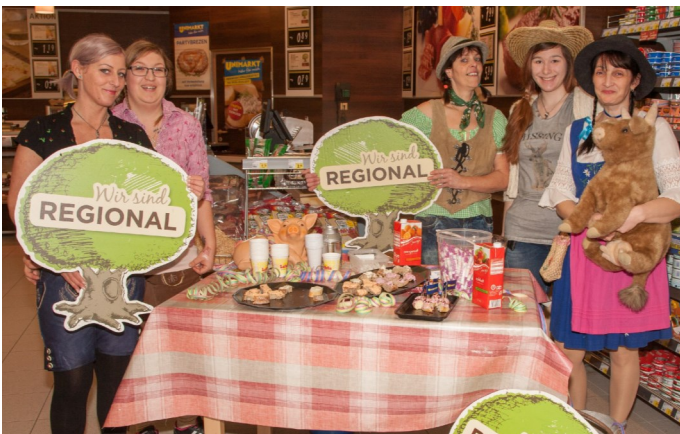
Auch das Team des Uni-Marktes wirkte mit originellen Ideen am bunten Faschingstreiben mit