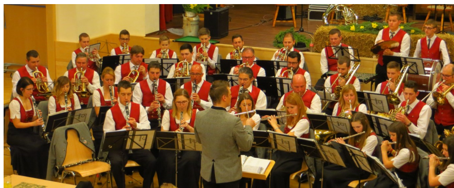
Foto unten: Der Musikverein Weistrach bot ein beeindruckendes Festkonzert