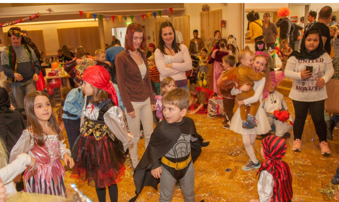
Auch beim Kinderfasching herrschte bei den kleinen Faschingsnarren ausgelassene Stimmung