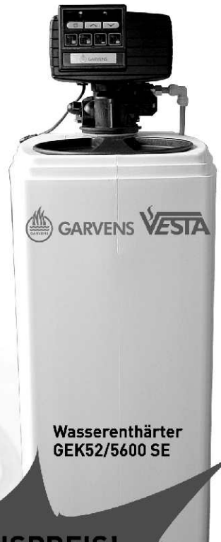
Wasserenthärter GEK52/5600 SE

Hartes Wasser enthält Härtebildner, die Kalkablagerungen in Waschmaschinen, Geschirrspülern, Duschen, Warmwasserbereitern, Kaffeemaschinen, Armaturen verursachen. Dadurch entsteht hoher Energieverbrauch (geringe Wärmeübertragung) und ein nicht zu bremsender Verfall der Maschine. Gewiss kann man bei jedem Waschgang ein Zusatzmittel gegen Kalk beimengen, doch diese Beigabe erspart man sich auf Jahre hinaus mit einer GARVENS VESTA Wasserenthärtungsanlage. Das moderne und wirkungsvolle Wasserbehandlungsverfahren hat sich seit Jahrzehnten in der Industrie bewährt, wurde in einem Konsumententest als sehr gut eingestuft, hilft zur Vermeidung von Hartwasserproblemen. Das Wasser wird weich, beugt Kalkablagerungen, Rost und Lochfraß vor. Als Regel gilt: Ab 20 Grad Wasserhärte wird eine GARVENS VESTA Wasserenthärtungsanlage zum Muss!