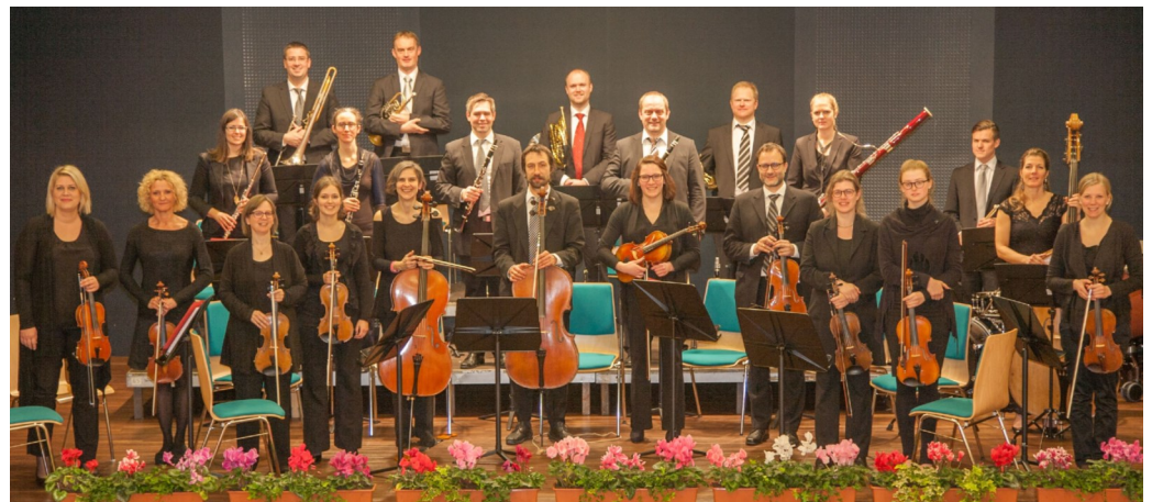
Foto: Das Ensemble des Musikschulverbandes begeisterte die Zuseher mit bekannten Stücken wie die Tritsch Tratsch Polka von Johann Strauß