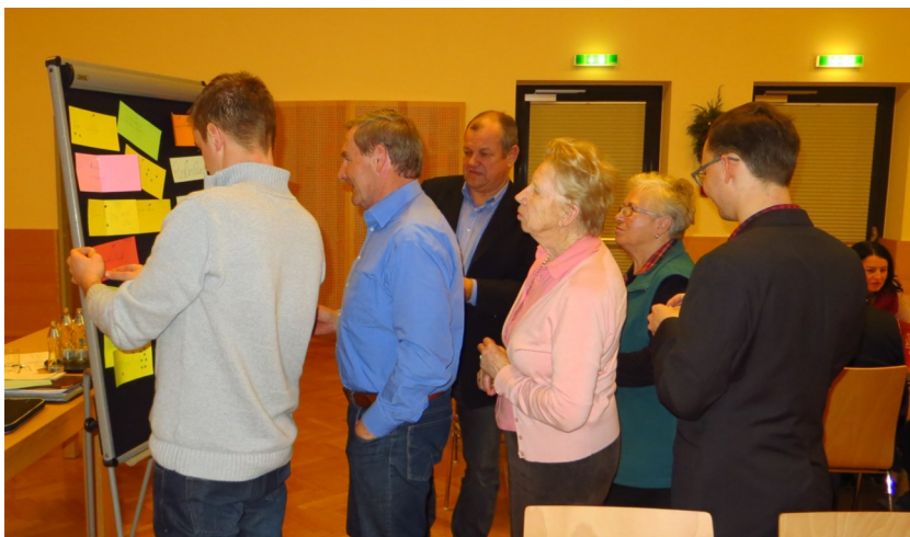
Neue Ideen bilden das zentrale Element des Bürgerbeteiligungsprozesses