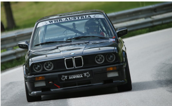
Willi Freudenschuß startet mit einem BMW E30 (ca. 240 PS) in der Central- Europameisterschaft ,die in 12 Ländern ausgetragen werden.