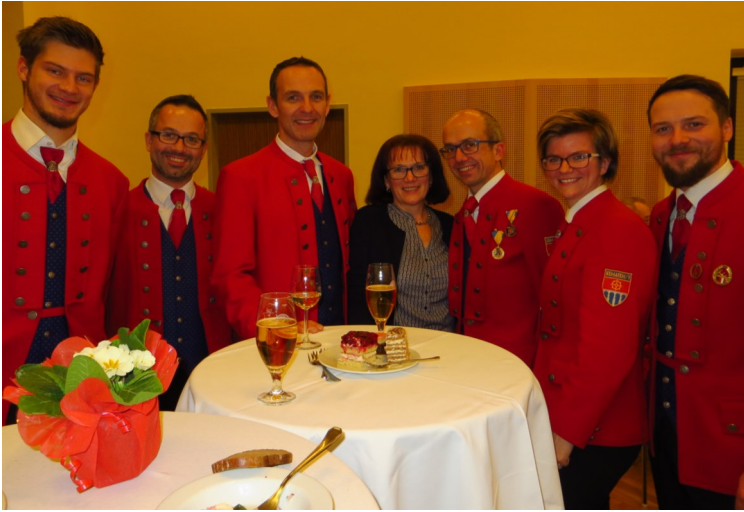
Der Musikverein Hilm-Kematen sorgte bestens für die musikalische Umrahmung