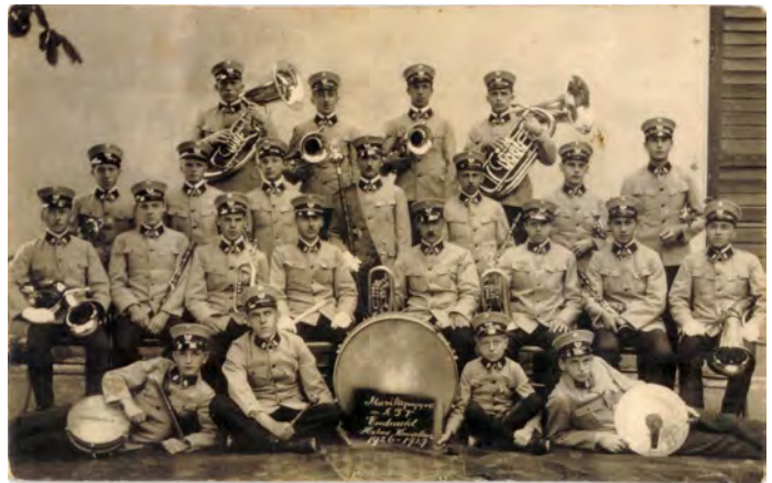
Foto: Die Gründungskapelle beim einjährigen Gründungsfest am 10. Juli 1927