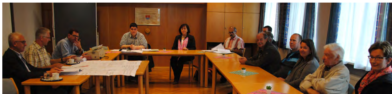
Foto: Die Bauverhandlung am Gemeindeamt als offizieller Startschuss zu den Bauarbeiten

Unmittelbar nach dem Schulschluss starteten bereits die Abbrucharbeiten für den ersten Bauabschnitt. Es erfolgt ein zweigeschossiger Neubau mit Flachdach, der durch die U-förmige Anordnung einen Pausenhof schafft. Weiters ist die Adaptierung der Kellerräumlichkeiten zu einem modernen Fitness- und Bewegungszentrum geplant. Dieser Bereich wird zukünftig für die gesamte Kematner Bevölkerung zugänglich und nutzbar sein! Die Fertigstellung soll bis 2019 erfolgen. Die Gesamtkosten betragen rund € 4,5 Mio. Euro.