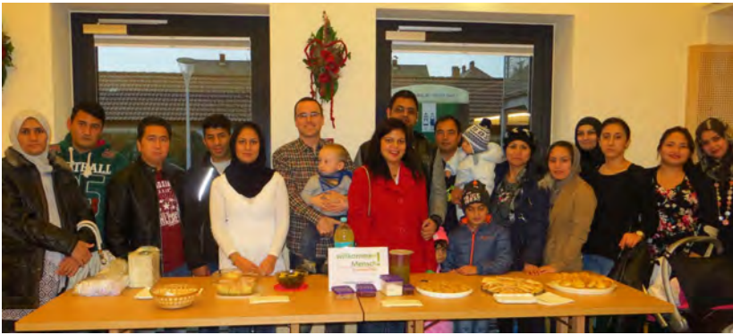
Das interkulturelle Buffet der Initiative Willkommen Mensch Kematen fand großen Anklang