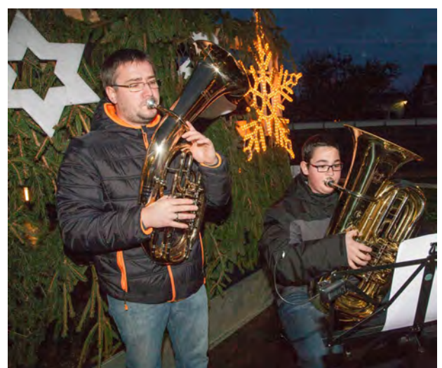
Die Schüler der Musikschule brachten stimmungsvolle Weihnachtslieder vor