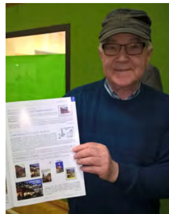
Foto: Der Verkauf der Sonderbriefmarke, die zu diesem Anlass hergestellt wurde, erwies sich als voller Erfolg