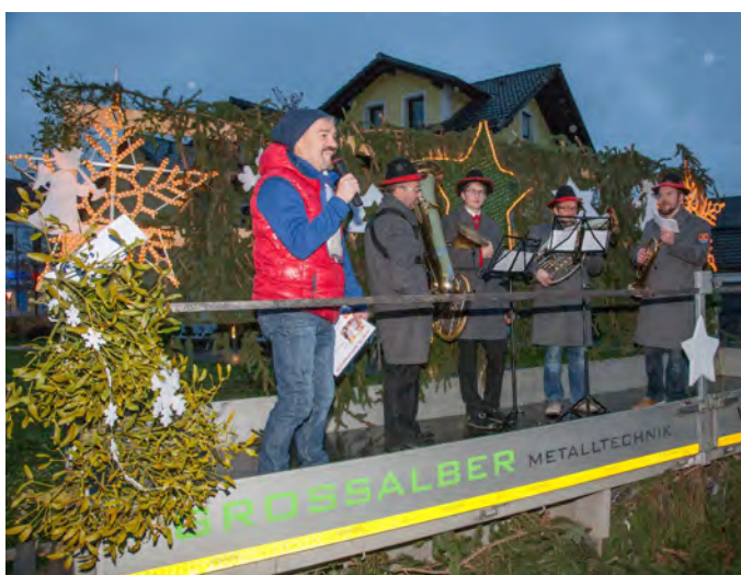
Der Musikverein Hilm-Kematen spielte Weihnachtsmusik auf