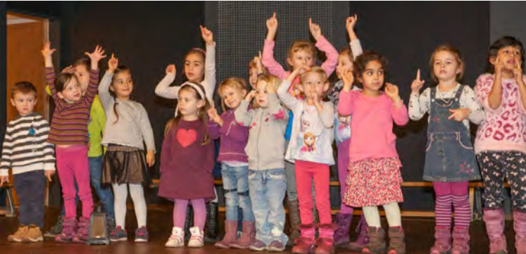
Die Kindergartenkinder sangen von „der Laterne“