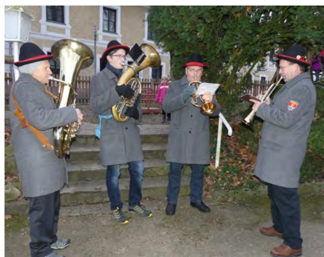
Foto: Ein Ensemble des Musikvereins Hilm-Kematn sorgte für die musikalische Umrahmung