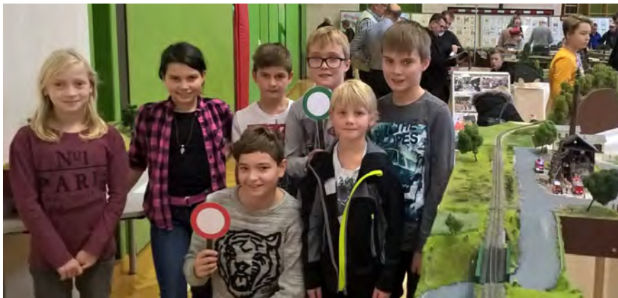
Foto vlnr: Im neu renovierten Turnsaal waren Schmalspurmodule aufgebaut, die äußerst detailreich und liebevoll gestaltet waren.

Von 25.11.-27.11.2016 fand in der Volksschule Kematen eine sehenswerte Modelleisenbahn- und Briefmarkenausstellung statt. Beteiligt waren 100 Kinder der Volksschule, das Lehrerteam, der Elternverein der Volksschule, der Arbeiter-Briefmarken-Sammlerverein Hilm-Kematen, die Schmalspurmodulbaugruppe, das Niederösterreichische Medienzentrum Amstetten und der Musikschulverband Allhartsberg-Kematen. Briefmarken wurden gesammelt, Module gebastelt, Lokomotiven ausgesägt, Kuchen gebacken, Adventbasteleien angefertigt, ein Film gedreht und Vieles mehr. Danke an alle die vielen Menschen, klein und groß, die zum Gelingen dieses Wochenendes beigetragen haben.