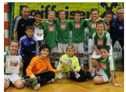
U 11