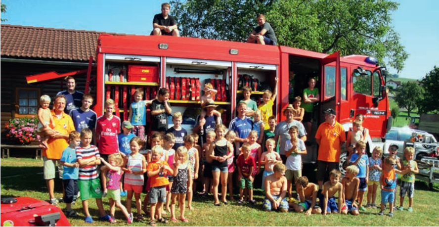
Feuerwehr, FF Kornberg-Schlickenreith