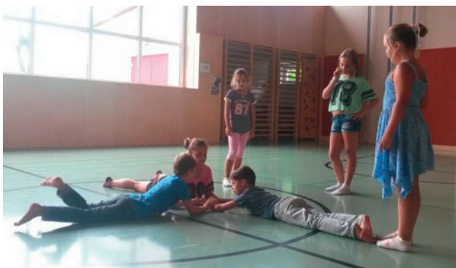
Neuhofner Schulkinder wurden in den Ferien in der Volksschule betreut.

chen an die Jugend. Wir wollen ihnen damit auch einen Einblick in die verschiedenen Aufgaben der Gemeindegarbeit geben.