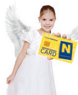
Foto niederösterreich card

Gültig ist die neue Karte vom 1. Jänner 2016 bis 31. März 2017, eine bestehende Karte kann mit dem Verlängerungsgutschein ab 1. März 2016 verlängert werden und gilt ab 1. April 2016.