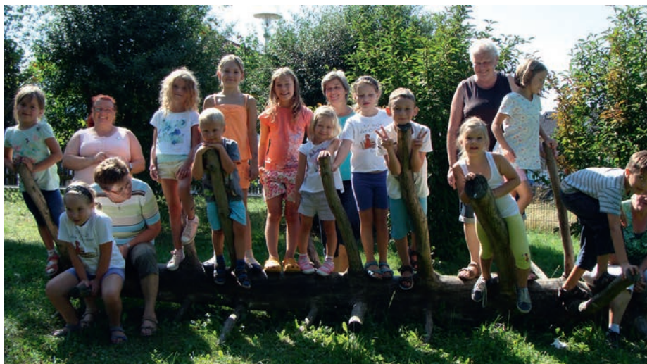
Alte Kinderspiele, Goldhauben