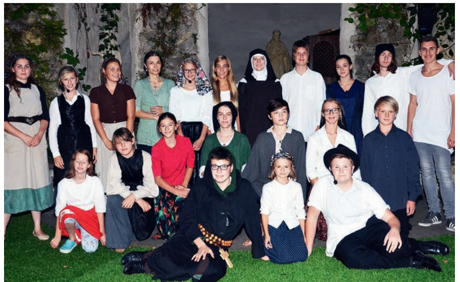
Hirtenkinder von Fatima