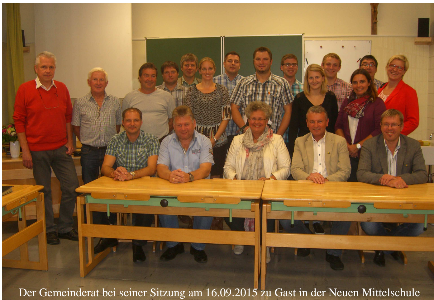
Der Gemeinderat bei seiner Sitzung am 16.09.2015 zu Gast in der Neuen Mittelschule

Die Gesamtkosten dieser Investition betragen ca. € 450.000,- und werden durch eine Förderung des Landes Niederösterreich unterstützt.