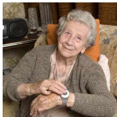
Auf Knopfdruck sind Sie in Notfällen mit der Notrufzentrale der Volkshilfe NÖ verbunden.