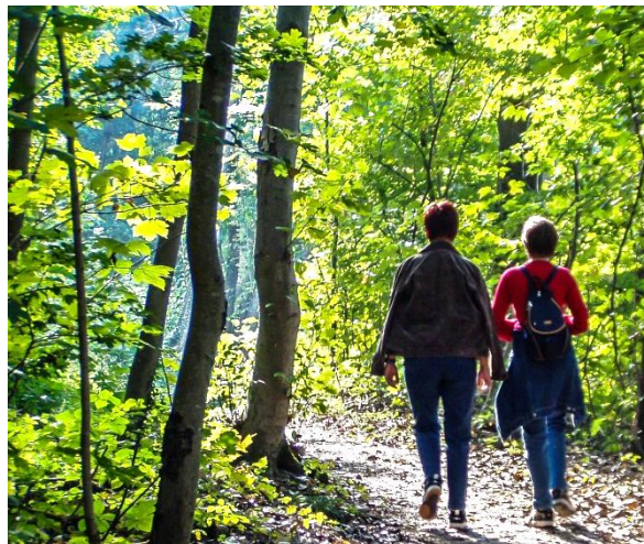
Zur Präsentation sind alle StrengbergerInnen recht herzlich eingeladen.

Weiters werden die im Zuge des Kinderferienpro- grammes 2016 beim Programmpunkt " Fotosafari mit Filmemacherin " von den Teilnehmern im Markt geschossenen Fotos prämiert. Dazu werden die dabei teilgenommenen Kinder recht herzlich ein- geladen. Die Fotosafari stand ganz im Zeichen des Gemeindegewandtes "Spurensuche in Strengberg".