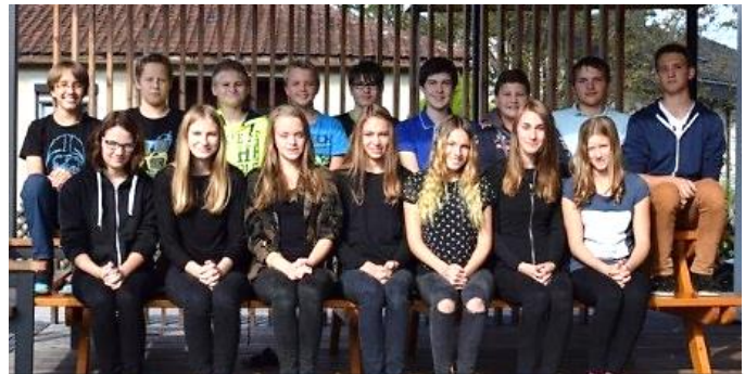
Die eifrigen Sammler der 4. Klasse NMS.

großem Engagement unterwegs. Ein besonderer Dank gilt der Großzügigkeit der Strengberger Bevölkerung.