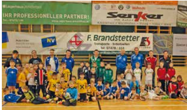
Alle Teilnehmer des U8 Turniers