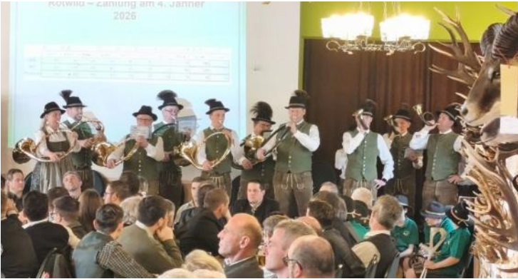
Alljährliche Hegeschau in Hollenstein am 14.3.