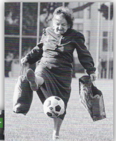
Alter schützt nicht vor TORheit

Oftmals braucht es aber auch liebevolle Angehörige, die fest hinter unseren älteren Menschen stehen und ihnen etwas Unterstützung bei der täglichen Motivation geben! Danke!