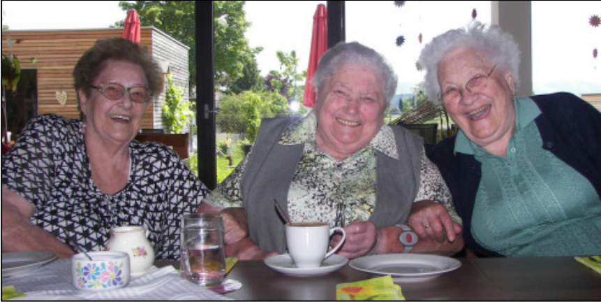
Freundschaften - Ein Bild sagt mehr als tausend Worte!