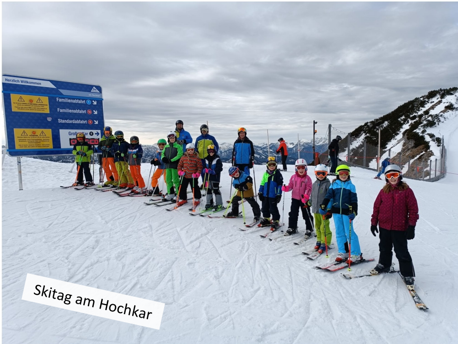
Skitag am Hochkar